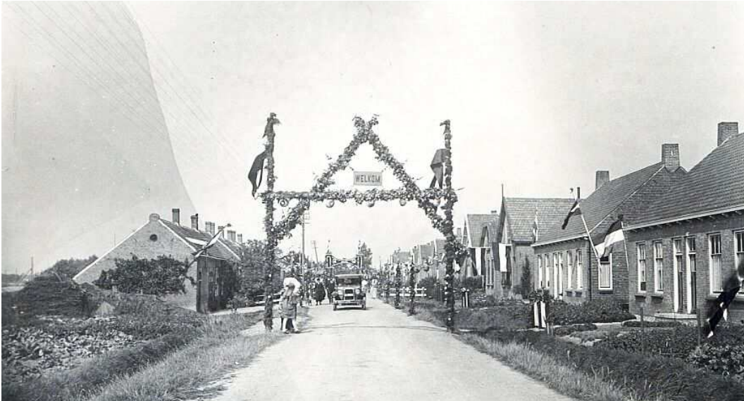
Situatie Molenweg ca 1935. Links voor ons huis

Mijn kinderen hebben wel eens gevraagd schrijf nu eens op hoe dat was, je vertelt er zo weinig over, we weten zo weinig, en omdat er ook in een ander verband naar gevraagd werd, heb ik besloten er wat over te schrijven. Ik, de jongste van zeven kinderen, ben geboren op 9 november 1943 en was dus op dat moment 9 jaar.