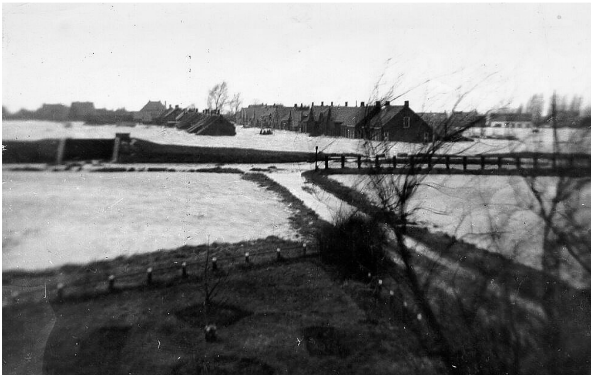
Zondagmorgen februari 1953 op het moment dat een deel van de familie de Regt in de reddingboot zit.