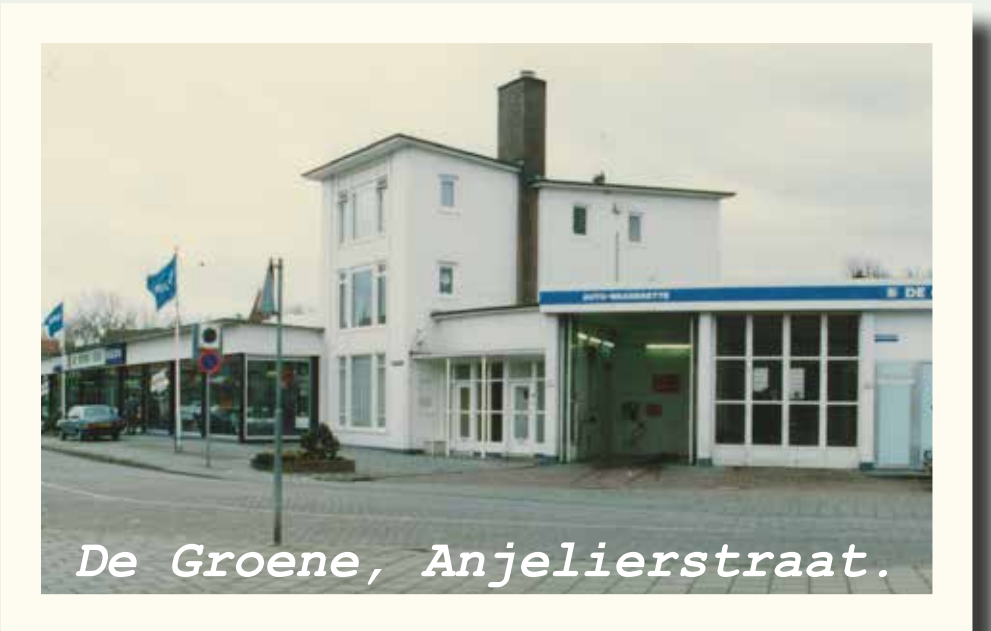
De Groene, Anjelierstraat.

Vanaf 1950 beginnen garages, net als andere grote bedrijven, langzaam uit de nauwe binnenstad te vertrekken. Op het bedrijventerrein aan de Marconistraat vestigt garage Adria zich in die tijd in een 'industrial' in de schaduw van de Hollandia-schoorsteen. Aan de Anjelierstraat vestigt zich firma De Groene, die auto's en vrachtauto's van het merk DAF, en later Volvo, verkoopt.