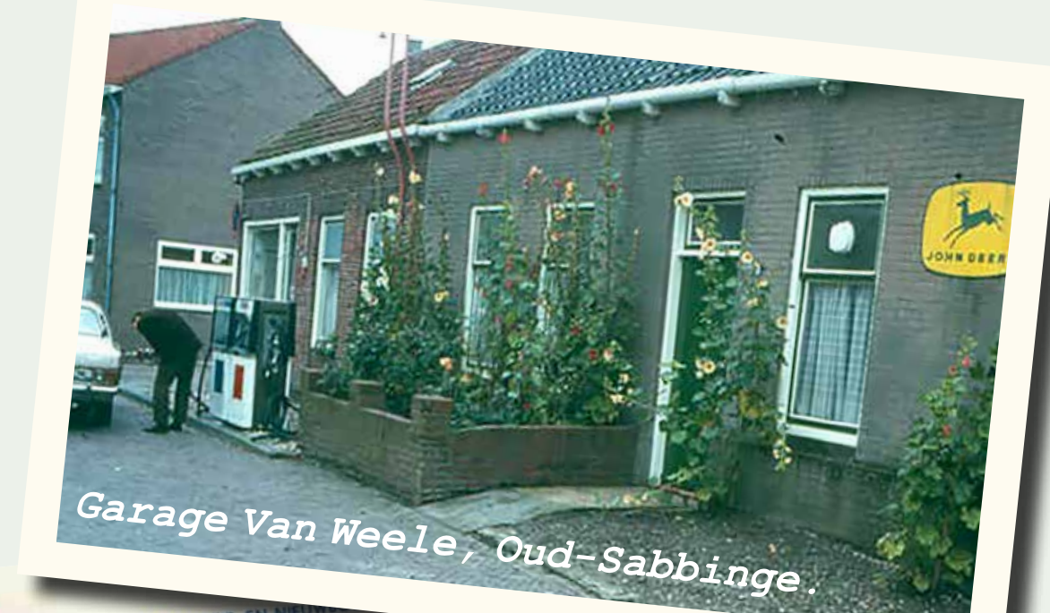
Garage Van Weele, Oud-Sabbinge.