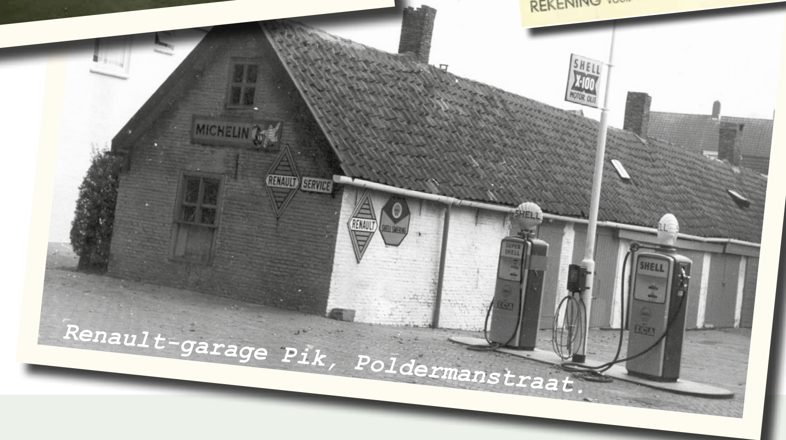
Renault-garage Pik, Poldermanstraat.