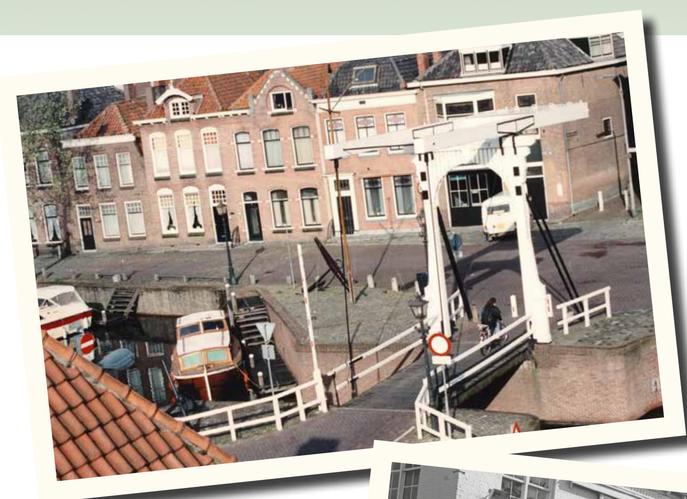
Garage Willeboer, Kleine Kade 1.

Vanaf het moment dat de pioniers aan het begin van de twintigste eeuw de eerste autogarages stichten, neemt het aantal autobedrijven snel toe. Een greep uit de garages die Goes rijk is (geweest)!