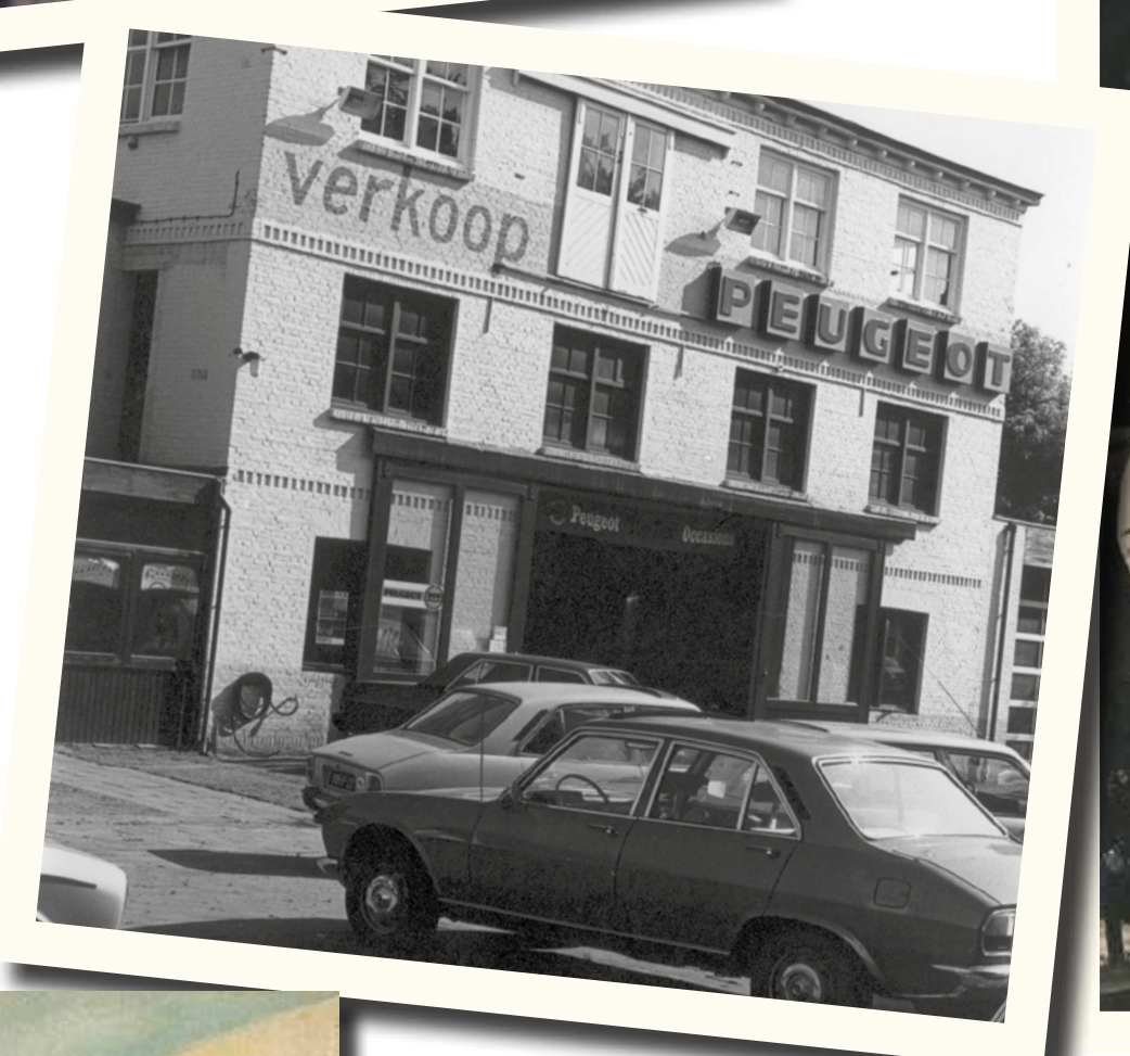
Peugeot, Jacob Valckestraat.