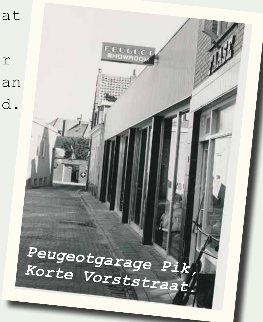
Peugeotgarage Pik, Korte Vorststraat.

Garage Louisse wordt Auto Hendriks, een bedrijf dat naar Klein Frankrijk wordt verplaatst. Hartje binnenstad is Peugeot-garage Pik aan de Korte Vorststraat bijna onvindbaar.