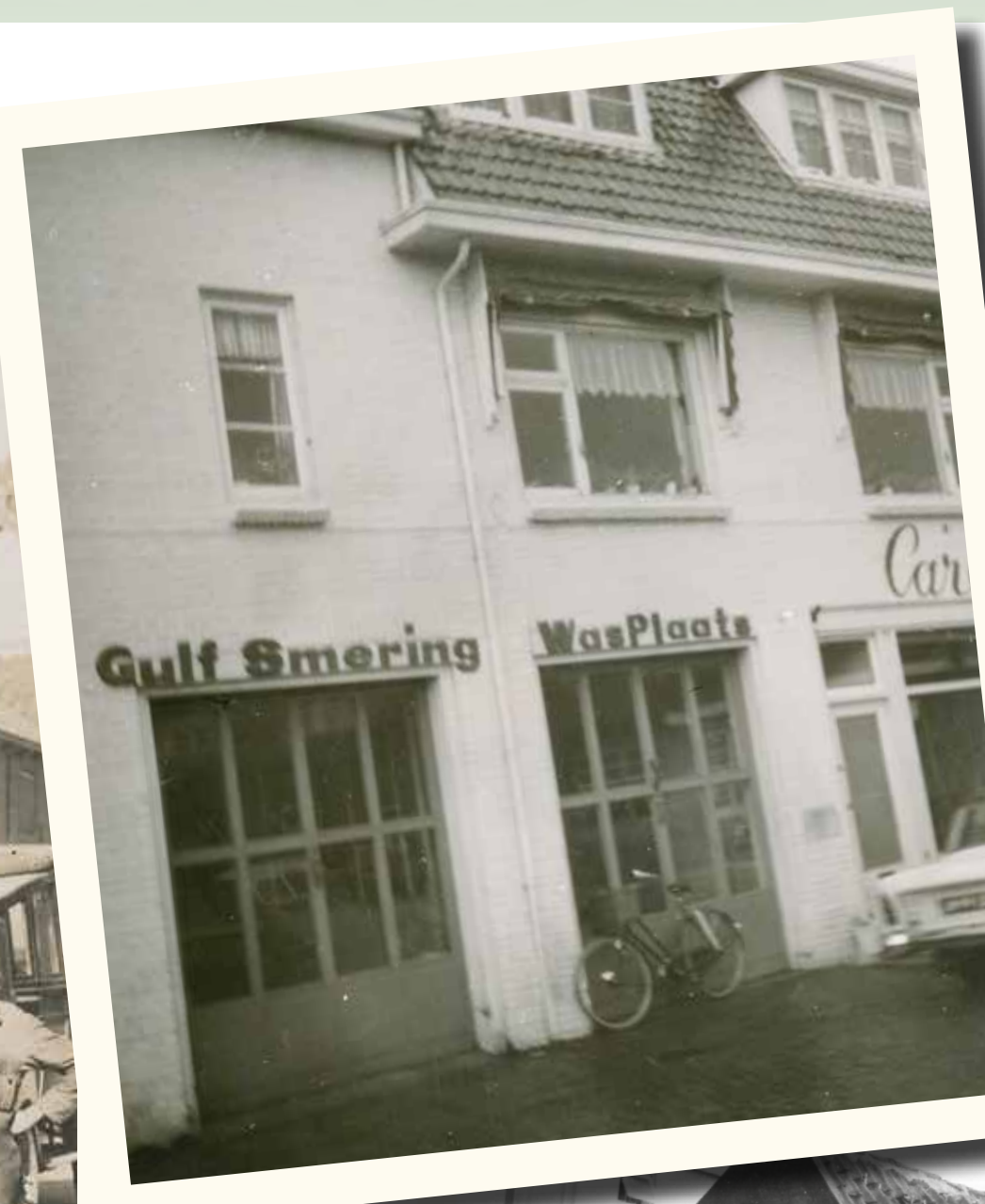
Carels, J.A. Blanckstraat.