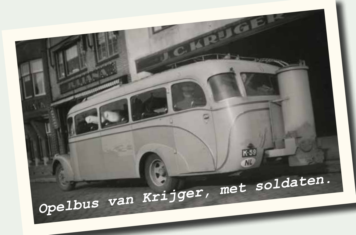
Opelbus van Krijger, met soldaten.

Als de Duitse bezetter in 1943 een lijst van autogarages in Goes laat maken, is hier bijna een alfabet van te maken: Adriaanse (2 keer), Back en Van de Vliet (in de jaren 1930 adverterend met 'de hypermoderne Adler autobaanwagen'), De Bie (vertegenwoordiger Saarloos), Buijsrogge, Le Coq, De Dreu, Van Fraassen, Den Herder, Koolen, Krijger, Louisse, Platteeuw, Spelier, Van Strien (2 keer), Verstrengre, Willeboer en Zandee. Een totaal van 19 bedrijven. De oorlog brengt een bijzonder fenomeen op de weg: auto's en vrachtwagens die, bij gebrek aan benzine, met een gaskachel moeten worden aangedreven. Ook garage Louisse bouwt dergelijke voorzieningen, zoals op een Opelbus van de firma Krijger, en op losse karretjes achter een personenauto, zoals een 'Ostmarkgenerator' voor een Buick van de firma Gebroeders De Jongh uit Goes.