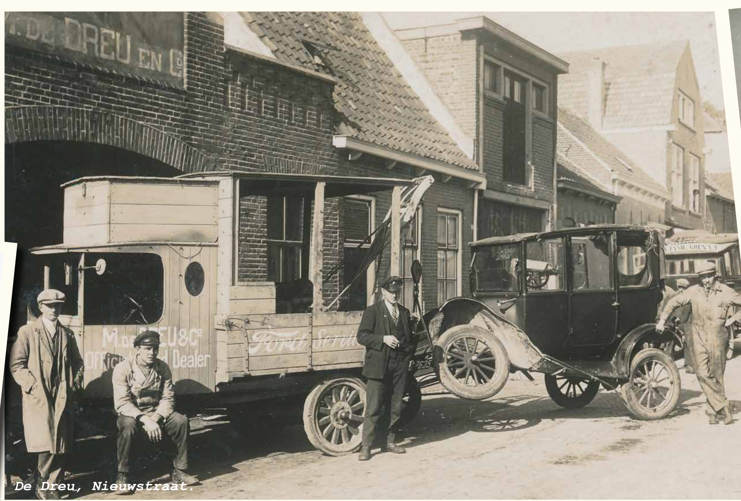
De Dreu, Nieuwstraat.