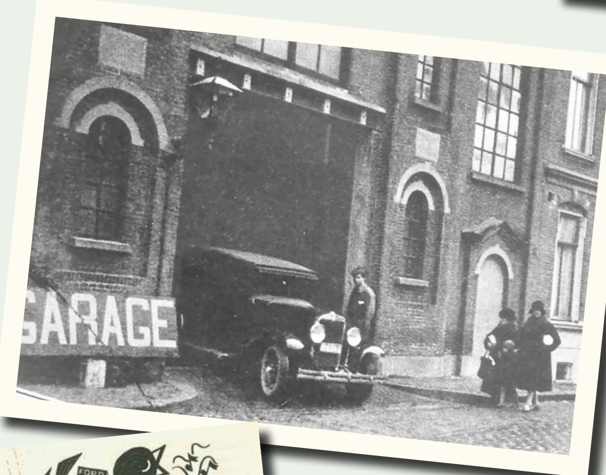
Garage in oude kerk Wijngaardstraat.