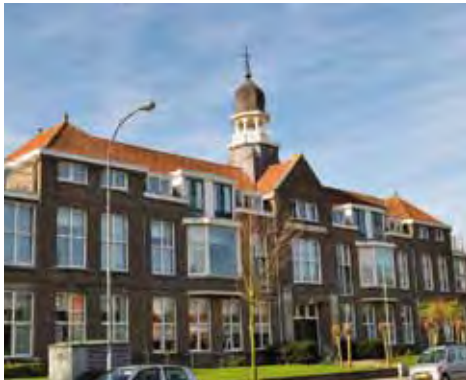
Appartementen 'Sint Joanna' Kloetingseweg

In 1911 begon men met de bouw van de watertoren. In 1913 was deze gereed en werd de waterleiding op Zuid-Beveland in gebruik genomen. Watertorens hadden meestal een functie voor het openbare waterleidingnet, soms ook voor proceswater in een fabriekscomplex, de stoomtreinen van de spoorwegen of als reservoir voor bluswater. De oudste watertoren dateert uit 1873 en de jongste uit 1970. Sommige zien eruit als een kerktoren, andere vormen een integraal onderdeel van een bedrijfsgebouw. De meeste zijn van beton of baksteen. Die van Goes bestaat uit een stalen kuip, omgeven door een betonnen wand. Het geheel staat op een open staalskelet, bestaande uit acht kolommen. Hij is ontworpen door Carel Francke uit Breda. In 1990 werd de watertoren afgestoten door de Watermaatschappij Zuid-West Nederland. In 1994 werd de toren gekocht door Van Garderen & Dekker Projectontwikkeling. In de toren werden kantoren gevestigd. Ook werd er een lift in de toren aangebracht.