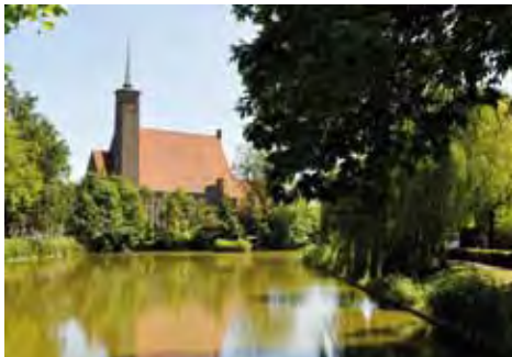
^ Westerkerk Westwal

In 1929 werd de grond voor de bouw van de Westerkerk aangekocht. Daarna begon de bouw naar een ontwerp van architect A. Rothuizen. De kerk is gebouwd op het voormalige Ravelijn De Grenadier. Op 30 augustus 1930 was de kerk voltooid. De architectuur is een mengvorm van de Amsterdamse- en Delftse School. Tot 2007 was het gebouw in bezit en in gebruik bij de Gereformeerde kerk. Door kerkfusie werd het gebouw overbodig. Het werd verkocht aan de Stichting tot instandhouding van de Westerkerk. De kerk is van belang vanwege de architectuurhistorische waarde en vanwege de opvallende locatie.