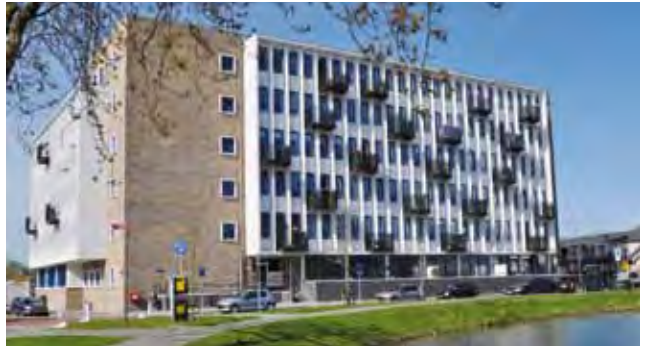
v.m. Landbouwcentrum >>