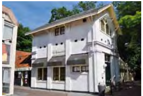
⤴ Restaurant 'De Stadsschuur'

In 1876 werd ter vervanging van een ouder washok deze wasserij gebouwd bij het voormalig weeshuis. Het vormt samen met de voormalige stadsschuur het gelijknamige restaurant. Deze stadsschuur werd in 1847 belangrijk verbouwd. De schuur werd door het manhuis en het weeshuis gezamenlijk gebruikt. In de lengte werd de schuur door een muur in tweeën gedeeld. Ieder gebruikte dus de helft. Bij de verbouwing werd deze muur naar voren geplaatst. Hierdoor nam de ruimte van het weeshuis toe. In 1982 werd de schuur volledig gerestaureerd. Hij werd voor een belangrijk deel vernieuwd en door middel van een tussenlid aan de westgevel van de naastgelegen voormalige wasserij van het weeshuis gekoppeld.