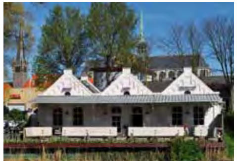
↑ Grand Cafe Raymondo, Dam 2

Dit pand werd in 1912 gebouwd in de neo-rennaissance stijl. Oorspronkelijk was het een driebeukige smederij, bestaande uit 3 traveeën van 6 x 9 meter en drie topgeveltjes. Deze verzezen enigszins boven het dijktaalud van de Keizersdijk. Het werd ontworpen door de bekende Goese architecten Rothuizen en De Koning. De smederij voor landbouwgereedschap was eigendom van de firma Massee. Aan het eind van de vorige eeuw werd het pand verbouwd. Tegenwoordig doet het dienst als restaurant. De achterzijde kijkt uit over de Voorstad. Men heeft een prachtig uitzicht op deze Voorstad en de Oostvest.