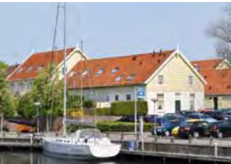
De Houtloodsen A. Joachimikade

Aan de A. Joachimikade staan de monumentale houtloodsen. Deze houtloodsen werden vanaf het begin van de 19e eeuw gebouwd voor diverse houthandelaren. Hierin werd het hout opgeslagen. Goes had tot in de 20e eeuw een grote houtbewerkingindustrie. In diverse wagenmakerijen, op scheepwerfjes en in fabrieken voor landbouwwerktuigen, kerkorgels, schoolmeubels en gymnastiektoestellen. Aan de stadsgracht bij de Westwal bevond zich in de periode 1860/1970 de stoomfabriek voor machinale houtbewerking La Vitesse van Van der Peyl. In de jaren negentig van de vorige eeuw werden de loodsen onder leiding van de Goese architect Maarten van Doorn, in opdracht van de Stichting Maatschappelijke belangen omgebouwd tot woonhuizen.