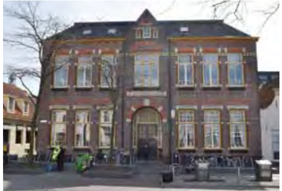
Appartementen Sint Jacobus Vlasmarkt