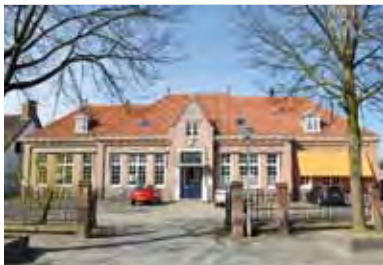
<< v.m. RK ULO

In 1921 werd met de bouw van deze school begonnen. Dit was eerst een lagere jongensschool. Deze werd in 1949 een volledige jongensschool. In 1952 werd er een katholieke lagere school in Goes Oost gebouwd aan de Bergweg en de school van de Westsingel verhuisde hier naar toe. De R.K. ULO school verhuisde nu naar de Westsingel. In 1963 werd het St. Willibrord college omgevormd tot een scholengemeenschap voor Atheneum-Havo-Mavo. De mulo ging als Mavo op in deze scholengemeenschap. Het gebouw aan de Westsingel werd verlaten. Het pand kwam nu in gebruik bij het Buitengewoon Onderwijs op Samenwerkingsbasis. Later is hier nog de Bestuurschool Zeeland gevestigd geweest. Tegenwoordig heeft het pand een bedrijfsfunctie en een woonfunctie.