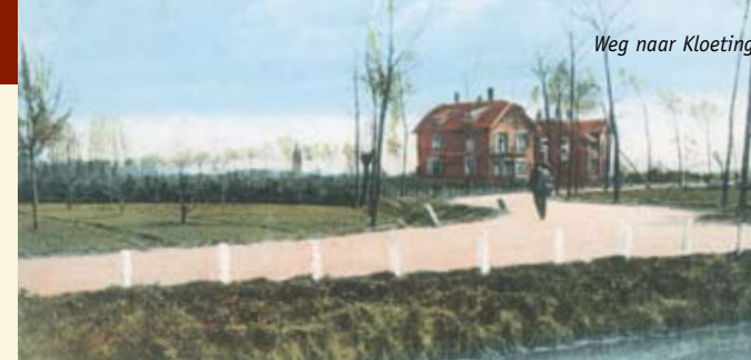
Weg naar Kloetinge