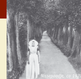
Nissepaadje, ca. 1920