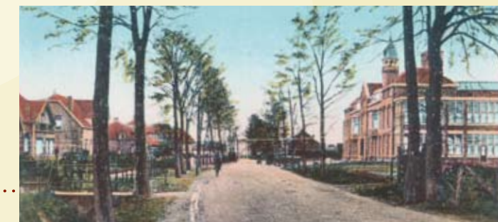
Kloetingsestraat met R.K. Ziekenhuis