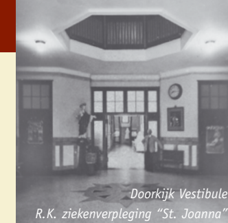
Doorkijk Vestibule R.K. ziekenverpleging "St. Joanna"