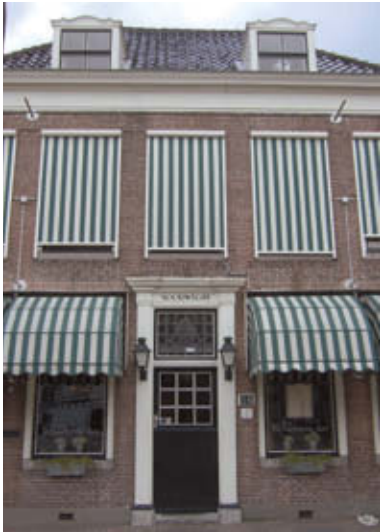
▲ Steakhouse De Lachende Koe, smaakpunt 12

Aan het eind van de Keizerstraat gaat u rechtsaf naar de Beestenmarkt. Op deze markt werden vroeger enkele keren per jaar paarden- en rundmarkten gehouden.