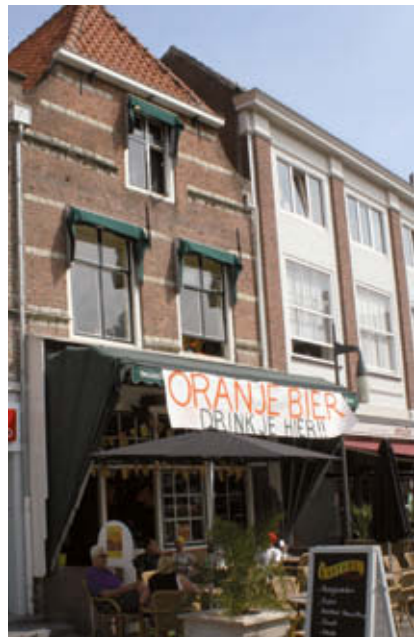
^ Café De Snor, smaakpunt 6

Links het voormalige postkantoor gebouwd in 1890 in neo-gotische stijl. Boven de ramen zijn fraaie mozaïeken aangebracht. Aan de rechterkant op nummer 10 één van de weinig overgebleven winkelpuien uit de 19e eeuw die nog in originele staat bewaard zijn. Even verder op nummer 4 bevindt zich smaakpunt 6, café De Snor. Specialiteit van de dag is koffie-snor-de-luxe, een heerlijk kopje koffie met een aantal lekkernijen voor € 2,95. Dit pand dateert uit de 17e eeuw en heeft een zadeldak. De gevel heeft zandstenen banden en muurankers. In de 18e eeuw werd er een pleisterlaag op de gevel aangebracht. In de 20e eeuw is deze verwijderd en werd de gevel in zijn oude glorie hersteld.