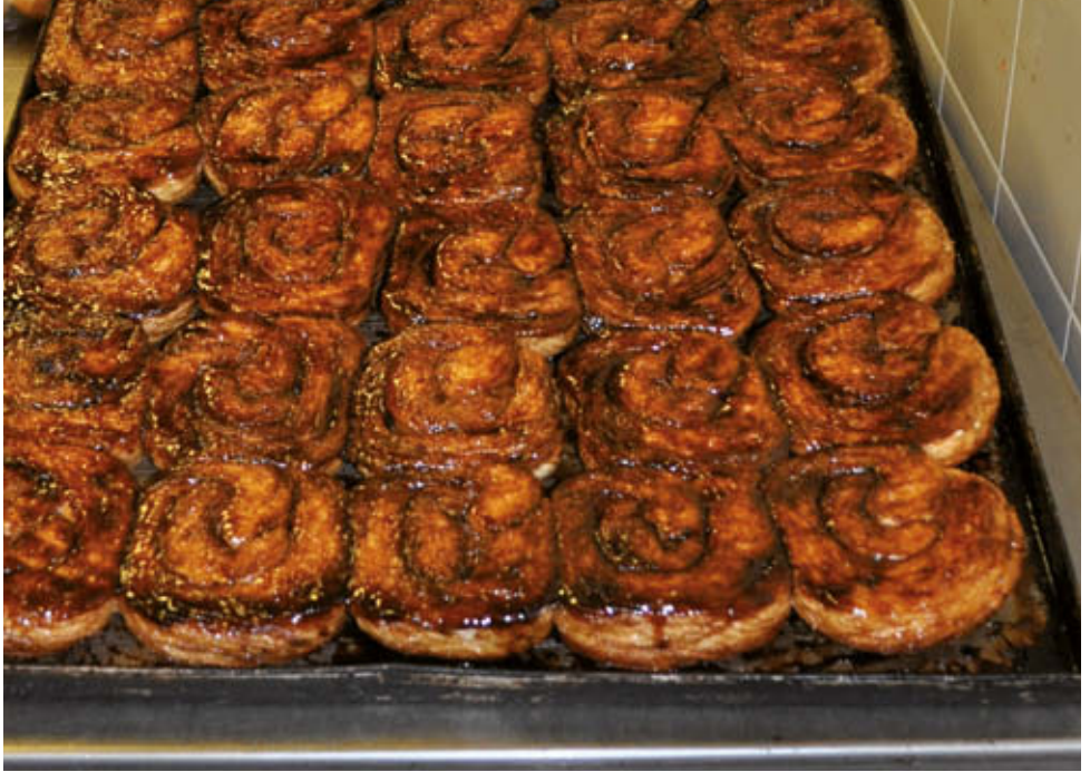
^ Zeeuwse bolussen