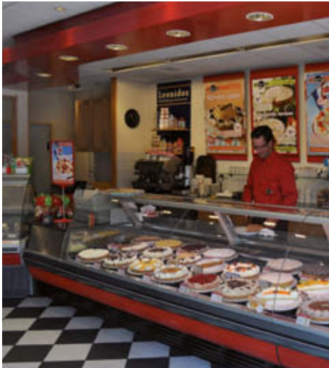
^ Multivlaai, smaakpunt 5