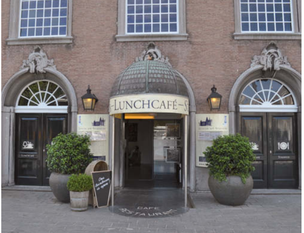
^ Lunchcafé Het Stadhuis, smaakpunt 1