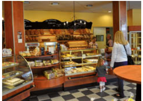
^ Bakkerij Den Soeten Inval, smaakpunt 7

U slaat rechtsaf naar de Opril Grote Markt en komt aan bij smaakpunt 7, bakkerij Den Soeten Inval. Vandaag van 11.00 – 15.00 uur ieder heel uur een rondleiding en demonstratie in deze ambachtelijke bakkerij. Specialiteit is een Zeeuwse bolus van de beste bolusbakker van het jaar 2008. De winkelpui is modern. Vanaf 1763 heeft het pand de functie van (banket)bakkerij. In de gootlijst is de tekst ‘anno 1555’ aangebracht, het bouwjaar van het huis. In 1554 is tijdens de stadsbrand het oorspronkelijke pand in vlammen opgegaan. Deze brand was ontstaan in de zoutfabriekjes aan de haven. Een kwart van de stad viel ten prooi aan deze stadsbrand. Heel de bebouwing rondom de haven werd in as gelegd.