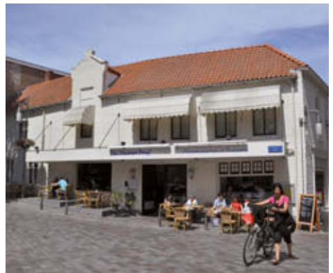
▲ Pannenkoekhuis & Brasserie De Steenen Brug, smaakpunt 4

Na 't Geveltje slaat u rechtsaf de Klokstraat in, die halverwege overgaat in de Ganzepoortstraat. U loopt de straat helemaal uit en treft op de rechterhoek smaakpunt 4 Pannenkoekhuis & Brasserie De Steenen Brug aan. Het restaurant biedt heerlijke specialiteiten. Ook kunt u informatie over de historie van het pand inzien.