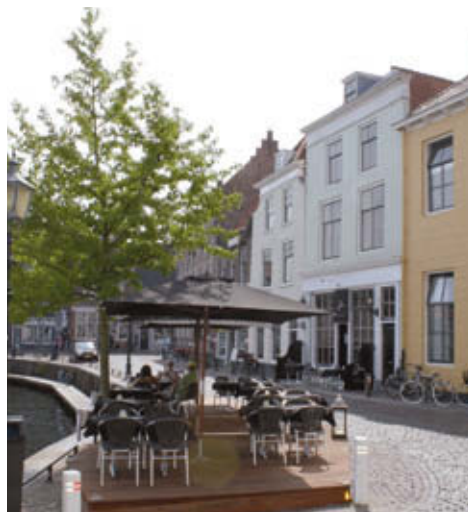
▲ Restaurant Jan Zilt Zalig Zeeuws, smaakpunt 11

De naam van deze straat is afkomstig van Huis de Keizer. Men wilde de populaire Keizer Karel V eren met een huis- en straatnaam. Tijdens een rondreis in 1540 heeft hij Goes bezocht.