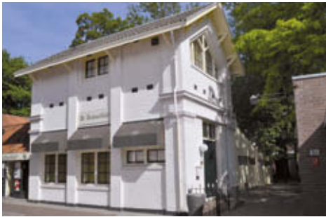
▲ Restaurant De Stadsschuur, smaakpunt 2

Achter op het pleintje het in de 19e eeuw gebouwde ‘waskot’. Hier werd het water opgewarmd voor de wekelijkse wasbeurt van de wezen en voor het wassen van de kleding. Aansluitend aan het waskot een schuur. Hierin is het restaurant De Stadsschuur gevestigd, smaakpunt 2. Het restaurant is gespecialiseerd in Zeeuwse streekgerechten, waaronder koffie met een ‘Goesevaartje’. De serveersters dragen vandaag de Zeeuwse klederdracht.