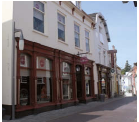
▲ Brasserie d' Anvers, smaakpunt 13

U bent aan het eind van de Smaakwandelroute gekomen.