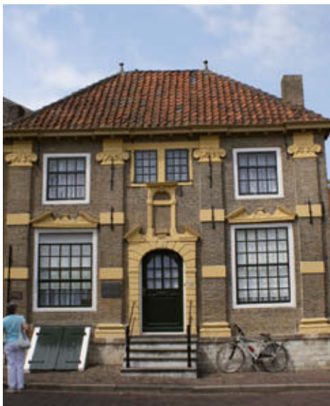
▲ J.A. van der Goeskade 69, smaakpunt 10

De route gaat verder over de Kleine Kade. De huizen aan deze kade werden in vroegere tijd bewoond door schippers. Tot 1800 bevond zich achter deze kade de Achterhaven.