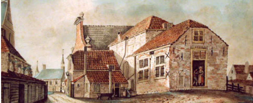
Slot Oostende achterzijde, aquarel door A Brandt, 1819

2 Korte Kerkstraat - Singelstraat Rechts van het stadhuis neemt u de Korte Kerkstraat richting Singelstraat en ziet u de prachtige gevel van het noordtransept, dit was de oorspronkelijke hoofdingang van de kerk.