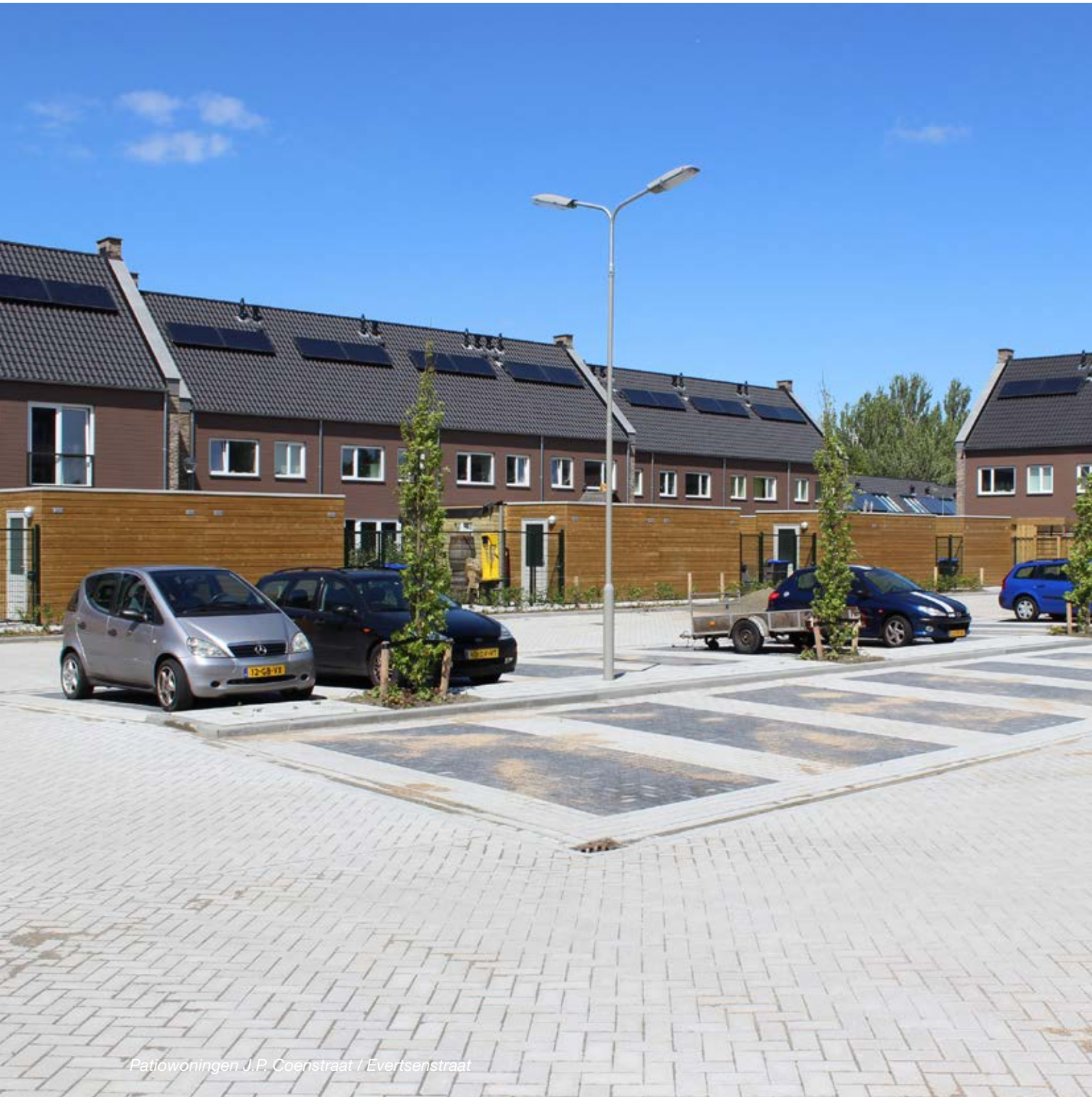
Patiowoningen J.P. Coenstraat / Evertsenstraat