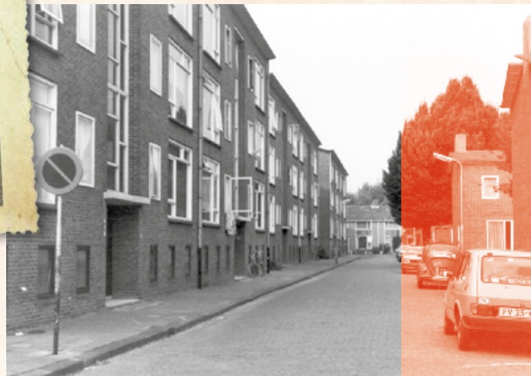
De Jan van Riebeekstraat in 1982