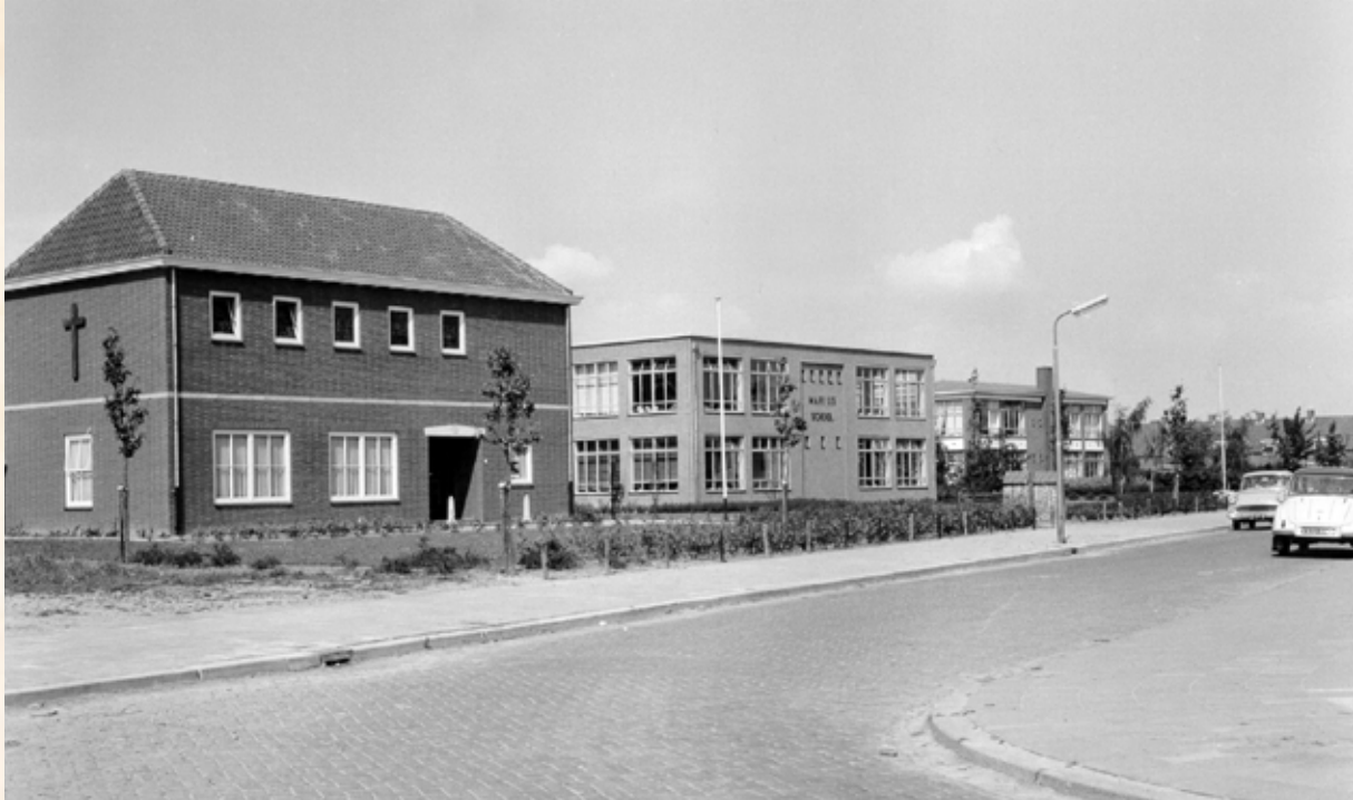
De J.P. Coenstraat in 1961. In het midden de rooms-katholieke Mariusschool en rechts de openbare H. van der Veenschool. Links van deze twee lagere scholen staat het voormalige nonnenklooster. Zusters uit dit klooster gaven les op de Mariusschool. Zij zijn al lang verdwenen, maar het kloostergebouw is er nog.