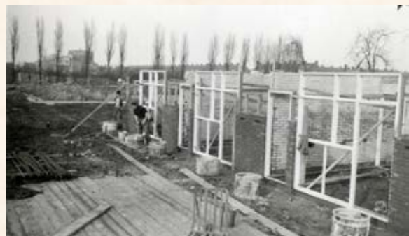
Begin van de bouw aan de Abel Tasmanstraat