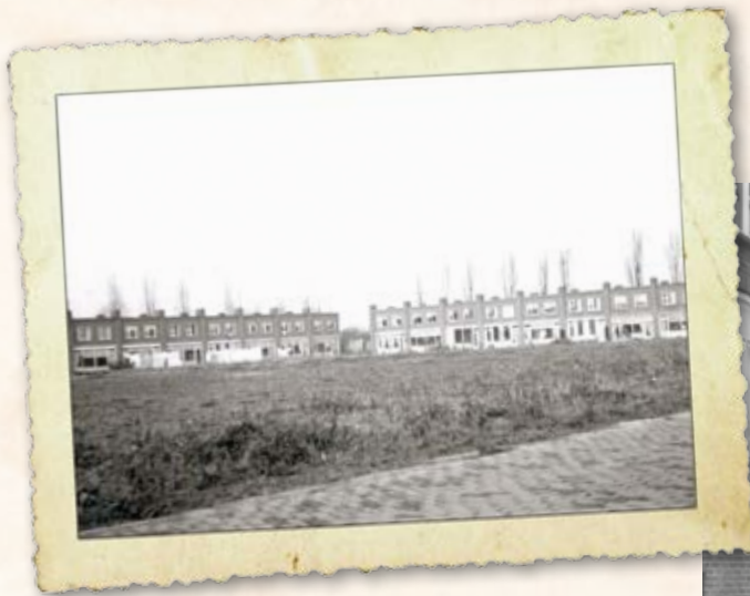
Zicht op de Abel Tasmanstraat in 1954