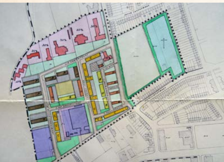
De uitbreiding op een kaart uit 1960

Bent u geïnteresseerd in de geschiedenis van Goes? Wilt u vier keer per jaar de nieuwsbrief van het Gemeentearchief Goes per mail ontvangen? Kijk op www.gemeentearchiefgoes.nl