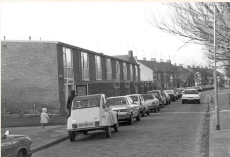
De J.P. Coenstraat in 1987