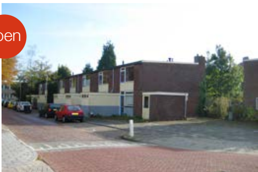
Locatie 10a ^ >