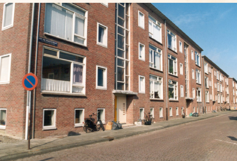
De Jan van Riebeeckstraat in 1991