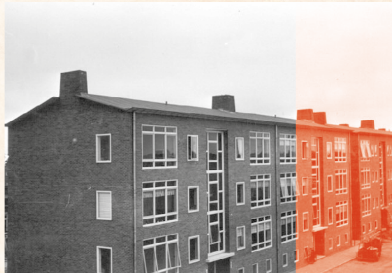
De Jan van Riebeeckstraat in 1956

Het gedrag van de heer Van Riebeeck is trouwens niet de reden voor het verdwijnen van de naar hem vernoemde straat in Goes-West. Dat komt namelijk door de sloop van de flats en de realisatie van de nieuwbouw, waardoor de Witte de Withstraat (de zeer strenge kapitein die ook geen lieverdje was...) nu doorloopt tot aan de Cornelis Houtmanstraat.