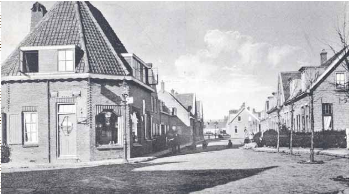
De Schengestraat met links de niet meer bestaande Hinckelingestraat. In de jaren zeventig werden de huizen gesloopt, in 1981 werd de naam definitief ingetrokken.

Het appartementengebouw dat straks in de Evertsenstraat komt te staan op het terrein van de voormalige Keuringsdienst van Waren gaat De Henry heten. Dat is de naam van een Engels schip dat een rol speelde tijdens de Vierdaagse Zeeslag in 1666.