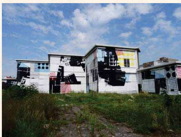
Zo zag de school er op het laatst uit. In afwachting van sloop en beschilderd in het kader van Mural Goes, de zomertentoonstelling van de Culturele Raad Goes. Foto augustus 2015.