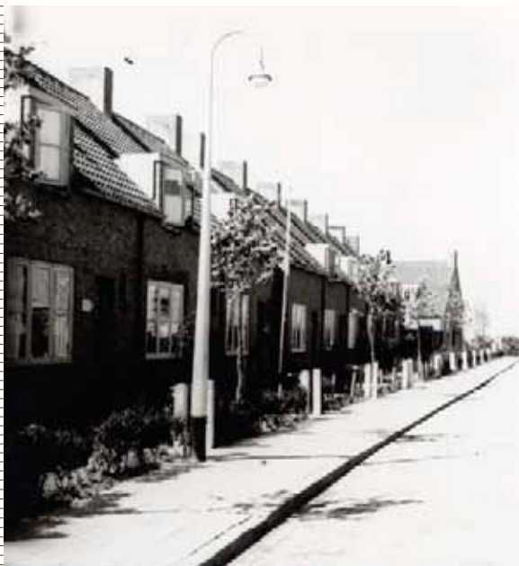
De Jacob Catsstraat in 1950

Het appartementengebouw dat straks in de Evertsenstraat komt te staan op het terrein van de voormalige Keuringsdienst van Waren gaat De Henry heten. Dat is de naam van een Engels schip dat een rol speelde tijdens de Vierdaagse Zeeslag in 1666.