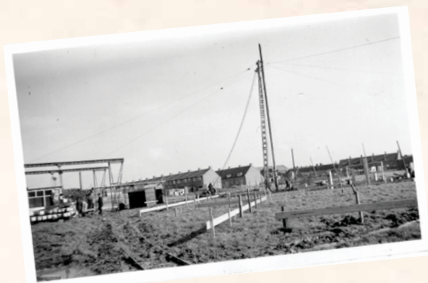
Heiwerkzaamheden voor de Prinses Margrietschool in 1954 of '55, aan de Naereboutstraat / Willem Barentzstraat. De foto is gemaakt in de richting van de Karel Doormanstraat met panden die rond 1950 gebouwd zijn, in de jaren tachtig gerenoveerd en relatief kort daarna gesloopt. Meer naar rechts de achterzijde van panden aan de M.A. de Ruijterlaan.