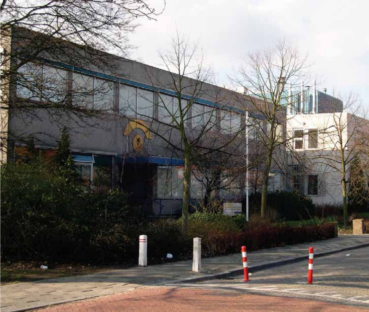
De Keuringsdienst van Waren in 2004.