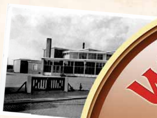
De Prinses Margrietschool ramen van het voorste lo onderscheiden.

Heeft u nog oude foto's Margrietschool of Deltaschool foto's van Goes-West? Het Gemeentearchief wil ze graag. www.gemeentearchiefgoes.nl .