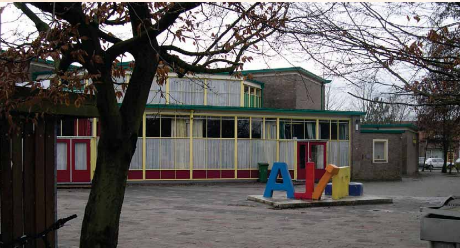
De Deltaschool in 2003. Voor de entree de letters (hier in spiegelbeeld) die samen de naam Delta vormen.

Goese Polder. Op die plek zit nu De Tweemaster. Een jaar daarna betrok de Deltaschool het gebouw. Bijna veertig jaar zou de Deltaschool hier blijven zitten. In maart 2014 verliet de Deltaschool het gebouw en trok in bij De Sprienke en De Tweern, eveneens scholen voor speciaal onderwijs.