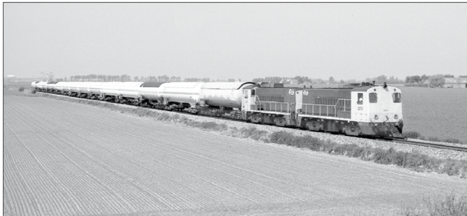
Bij Heinkenszand passeert op 14 mei 1992 NS met haar locomotieven 2273 + 2261 en goederentrein 55346. De trein zal in een ruk doorgaan tot Roosendaal.

Eind jaren negentig begon de studie naar een nieuwe ontsluiting van het Sloe. Vanwege de aanleg van een grote con-