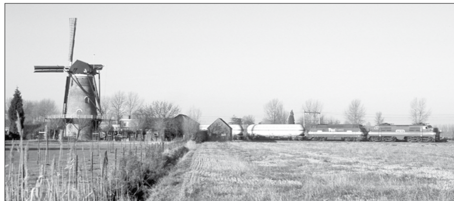
ACTS nadert op 8 december 2003 de hoofdlijn Roosendaal ~ Vlissingen met haar trekkrachten 1251 + 6702 en goederentrein 60209. Zij passeert daarbij de molen van Eindewege.

tainerterminal (die later door de rechter werd afgeblazen) werd een groei van het aantal treinen voorzien. Daarnaast leidde de route door de dorpen onderweg tot geluids- en trillingsoverlast, terwijl de vele overwegen tussen 's Heer Arendskerke en het Sloe niet pasten in het landelijke beleid om het aantal overwegdoden terug te dringen. Alsof daar dagelijks wat gebeurde. Wel groeide het aantal goederentreinen per dag: van vier in 1995 naar acht stuks in 1998 en dat was een toename van 100 procent. Voor de Zeeuwse overheid leek dat een probleem, maar landelijk gezien stelde dat niets voor. Tevens was elektrificatie gewenst, een mooi moment om de route zelf tegen het licht te houden. Er werd tenslotte gekozen voor een nieuw en veel korter tracé. Het buigt 2,9 km voor Arnhem (km 64,5) en is na 2,95 km in het Sloe. De nieuwe route is enkelsporig en kruisingsvrij aangelegd tot aan de rand van het industriegebied. Omdat de lijn langs weilanden loopt, zal er niemand meer last van hebben. Na een kleine daling had de vervoers-