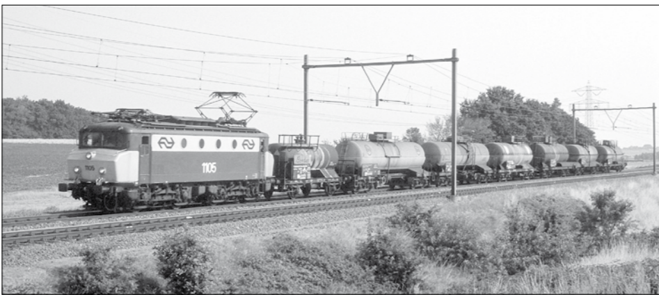
Locomotief NS 1105 is op 3 augustus 1990 bij Woensdrecht onderweg naar Kijfhoek. Nog steeds en vooral in de zomer bestaat de afvoertrein uit slechts enkele wagens van Hoechst.

een AKI of AHOB. De overwegen werden voortaan automatisch geactiveerd door een naderende trein. Voor storingen stond er nog een kastje waar de machinist met een sleutel de installatie kon inschakelen. Een paar jaar later was om redenen van veiligheid (!) het wisselen van locomotief in Goes voorbij en reden de goederentreinen