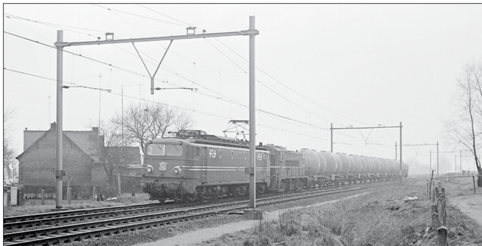
Locomotief NS 1308 heeft op 12 februari 1977 in Goes de enige goederentrein van die dag uit het Sloe opgehaald. Het is trein 720524, die met slechts enkele wagens van Hoechst en trekkraft NS 2333 (in opzending) Roosendaal nadert en onderweg is naar Rotterdam Zuid Goederen.

Meestal gingen de vrij korte goederentreinen met een elektrische locomotief serie 1100 of 1300 tot Goes en van hieruit via Eindewege met een diesellocomotief serie 2200. Het ging er gezapig aan toe. Evenals vroeger in de bietencampagne werd er bij de vele overwegen gestopt, waarna de op de locomotief meerrijdende rangeerder het weinige verkeer met een rode vlag tot stilstand bracht en weer opstapte om bij de volgende overweg hetzelfde te doen. Pas in 1992 kregen de drukste overwegen