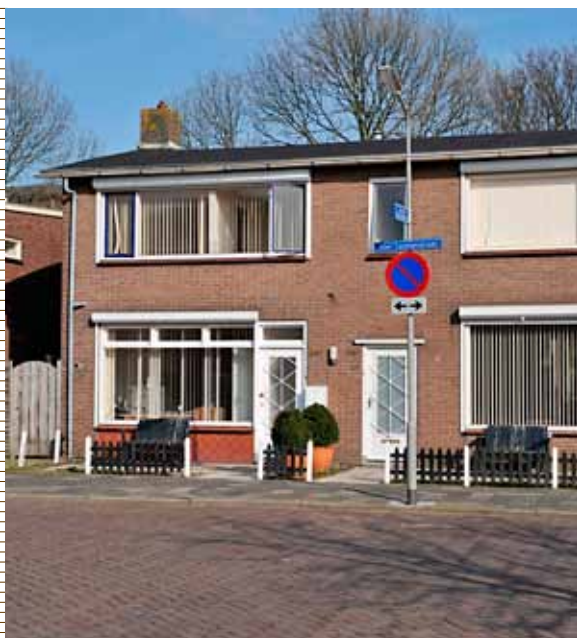
Een woning van Emergis

“De kraan van de douche instellen, dat valt nog niet mee. Soms heb je ook opeens koud water. Nee, tochtig en vochtig is het appartement niet. Maar het is best klein. En nogal oud.” Toch is Marcel best tevreden over zijn woning in Goes-West.