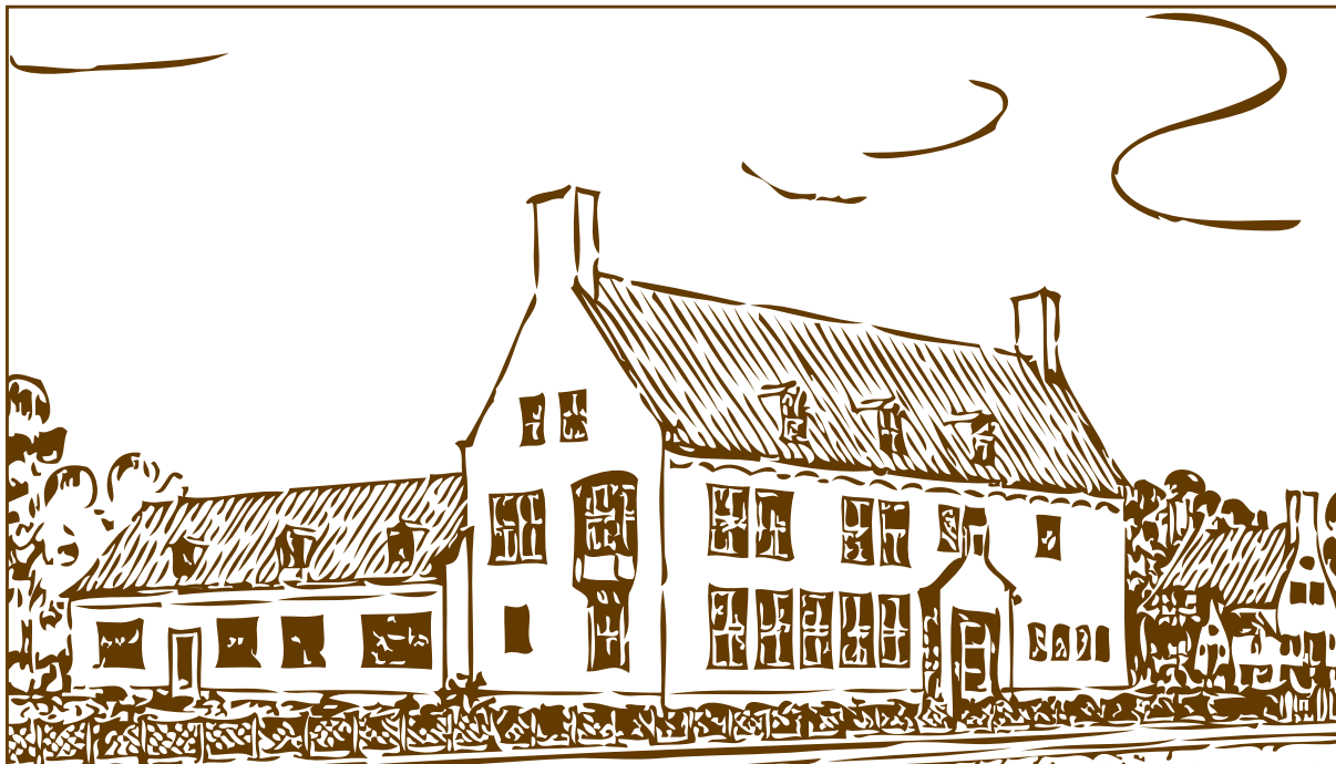
Artist impression uit 1953

de Poel bij Goes, vervolgens gekeurd, getaxeerd en verder doorgezonden naar Walcheren of Zeeuws-Vlaanderen. Van de aangevoerde runderen moesten er ongeveer 2.000 naar het abattoir. Varkens en schapen waren in de ondergelopen delen van Zeeland vrijwel alle verdronken, evenals het pluimvee. Naar schatting bleven er nog circa honderd paarden over. Op Tholen zou het aantal verdronken runderen 2.000 van de 5.000 bedragen. Bij Kruiningen verdronken tussen de 1.000 en 1.500 koeien. De afvoer van de kadavers was een groot probleem. De destructiebedrijven in Hansweert, Son en Overschie zaten bomvol. Met een bedrijf in Purmerend konden gelukkig zaken worden gedaan. Friesland schonk een k.i.-stier zodat de draad van de inseminatie weer snel kon worden opgepakt. De inseminator, die weer met de stierensperma op stap moest, kreeg een nieuwe dienstauto. Op de algemene vergadering van het Stierenstation in de Prins van Oranje in juni 1953 kon opnieuw de k.i. gepropageerd worden. Adjunct-directeur Groothuis van de GD hield een lezing en vertoonde een film. In alle nood van de Ramp viel een konijn met myxomathose te Kapelle nauwelijks op; het dier werd wel onderzocht door de GD.