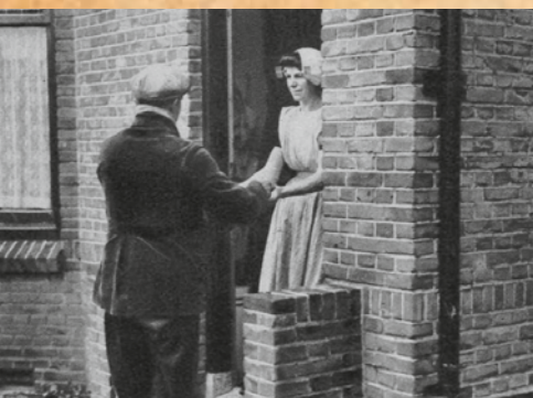
Aan huis bezorgen in de nieuwbouw van Goes-West, 1929