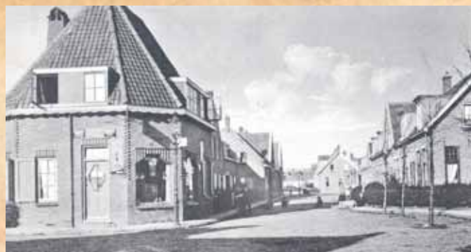
De buurtwinkel op de hoek van de Hinckelinge- en Schengestraat in 1930 en, inmiddels verbouwd, in 1965.