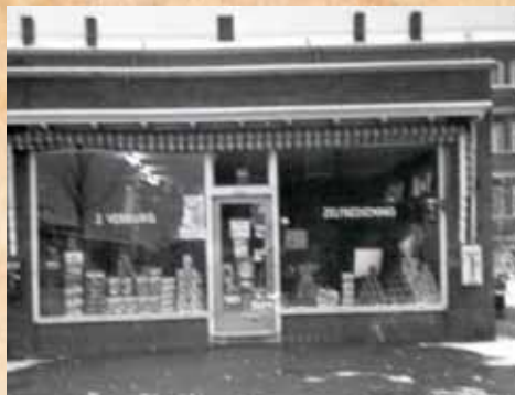
J. Verburg Zelfbediening in 1964