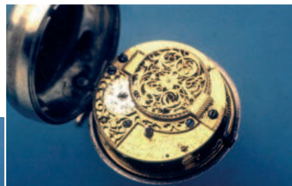
Afb. 1: Het horloge genummerd 305.

ham Tappy, echter zonder jaartal. 2 Wel is hier de toevoeging 'horloge collectie Schindler Nijmegen'. De horloges van Abraham Tappy die Peeters beschrijft hebben de opvolgende nummers 305 en 306 (Afb. 1a/1b en 2a/2b). 3 Ik mocht deze begin jaren negentig van de vorige eeuw reeds bekijken. Zodoende was ook Cees Peeters bekend met het horloge dat ik