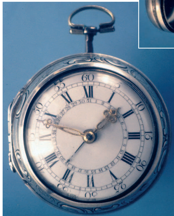
Afb. 2: Het horloge genummerd 306.