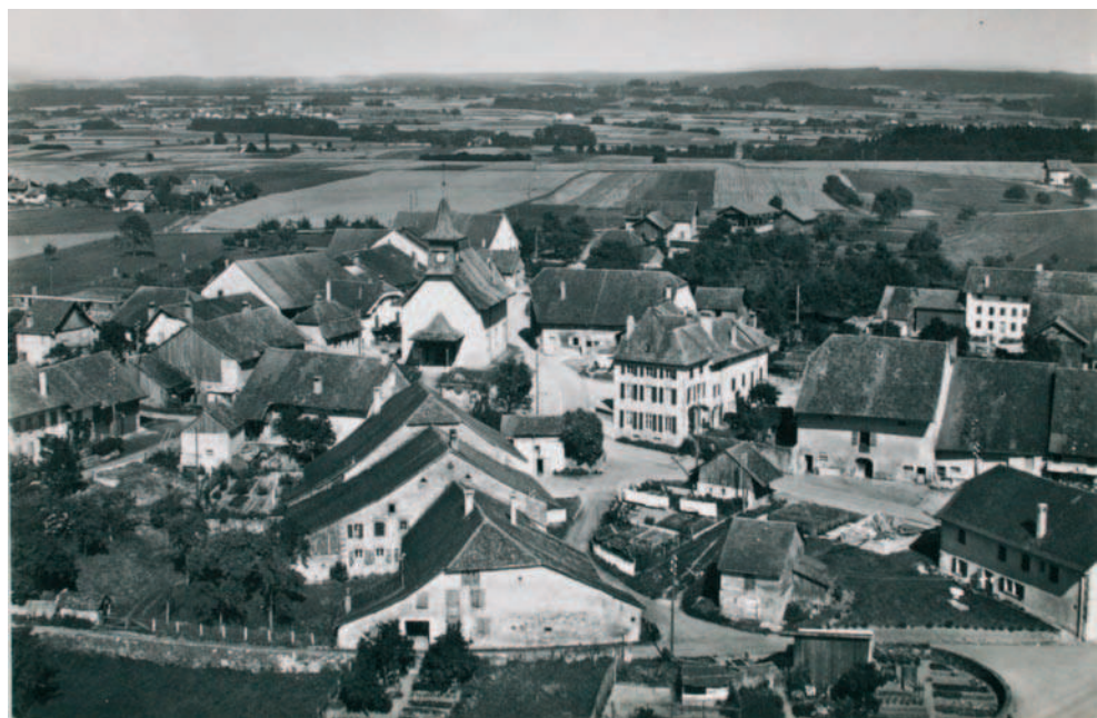
Afb. 6: Het dorpje Sullens rond 1960. Op een enkel gebouw na zijn de meeste huizen en boerderijen in de dorpskern te dateren uit de 17de eeuw met latere toevoegingen uit de 18de en 19de eeuw. De kerk werd in 1712/13 opgetrokken. De zolder van de kerk diende tevens als graanschuur.