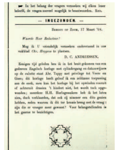
Afb. 3: Ingezonden brief van D.C. Andriessen in Christiaan Huygens , vakblad voor uurwerkmakers van 21 maart 1908.

Tappy en zijn horloge. Naspeuringen in mijn eigen archief maakte duidelijk dat mijn overgrootvader er al meer over wilde weten. In het tijdschrift Christiaan Huygens trof ik eigenlijk per toeval in de jaargang van 1908 het onderstaande aan (Afb. 3):