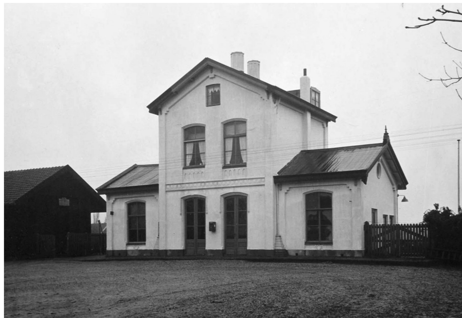
Stratzijde stationsgebouw Arnemuiden, 5 november 1953. Aan weerszijden van het hoge deel zijn aan de regenafvoerpijpen piramidevormige ombouwen aangebracht, zodat onverlaten die hoeken niet als urinoir kunnen gebruiken.

Het stationsgebouw Arnemuiden (km 64,487) werd opgeleverd in 1871. Die gebouwen uit de beginjaren van de Maatschappij tot Exploitatie van Staatsspoorwegen (SS) zijn ingedeeld in vijf klassen. Het merendeel hiervan behoort tot het type 5e klasse en wordt toegeschreven aan architect K.H. van Brede-