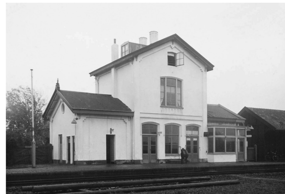
Perronzijde stationsgebouw Arnemuiden, 5 november 1953. Op het perron staat de handelinrichting voor de sluitbomen van de nabijgelegen overweg. Rechts daarvan ligt de uitbouw voor de treindienst-leider, daterend uit circa 1930, en de houten goederenbergsplaats uit circa 1875.