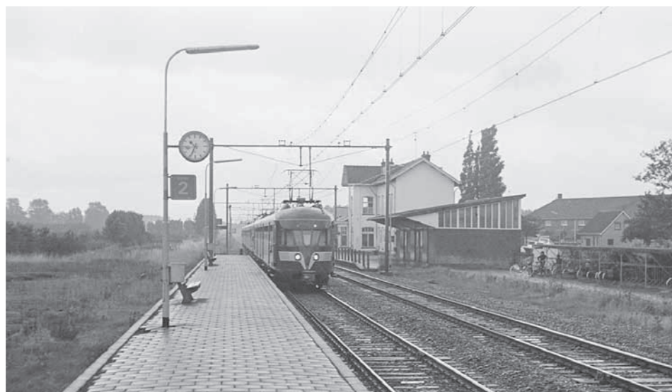
De treinstellen NS 280 en 1735 stoppen als trein 4627 (Zwolle – Vlissingen) in Krabbendijke. Links van het perron lag het vroegere spoor 3 met laad- en losweg aan de noordwestzijde. Rechts is de in 1990 afgebroken goederenloods te zien en het braakliggende terrein van de vroegere laad- en losplaatsen aan de zuidwestzijde. Foto Marius Broos, 31 juli 1976.

Tot voor enkele jaren terug kende het station niet zoveel reizigersvervoer. Dat werd mede veroorzaakt door het overwegend streng protestants-christelijke karakter van het kleine dorp, dat het reizen op zondag niet toestond. Bovendien reden de treinen niet altijd op het gewenste uur van de inwoners. De dienstregeling was ingesteld op de behoeften van reizigers uit andere en veel grotere plaatsen. Ondanks dit feit liet het college van Burgemeester en Wethouders zich op 28 april 1884 niet onbetuigd. In een rekest aan de minister van Waterstaat, Handel en Nijverheid verzochten de vroege vaders een extra trein te laten rijden om het gat in de dienstregeling op te vullen: 'dat tot groot ongerief van het publiek alhier in de richting Roosendaal – Vlissingen geene reisgelegenheid per spoor bestaat tusschen 's namiddags 4.3 [16.03 uur] en 's avonds 9.40 [21.40 uur], zoodat reeds sedert lang de behoefte gevoeld wordt aan een avond-trein, die in gemelde richting loopt, aan alle tusschenstations stopt en reizigers voor alle klassen vervoert.' Gedacht werd aan een trein die in Krabbendijke