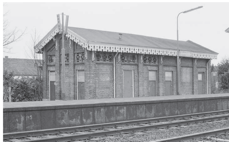
Duidelijk is aan het in 1990 afgebroken retiradegebouw met bergplaats te zien, waar zich de privaten en waterplaatsen (urinoirs) bevonden. 17 januari 1990.