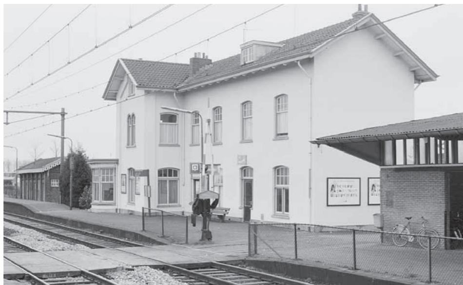
Perronzijde van het stationsgebouw met blokpost (links) te Krabbendijke. Links staat het retiradegebouw met bergplaats en rechts de goederenloods. Foto Marius Broos, 17 januari 1990.

aangelegd naast een laad- en losweg met verhoogde laad- en losplaats. In de jaren 1885-1887 kwam op het baanvak Bergen op Zoom – Kruiningen dubbelspoor tot stand (met extra wissels in Krabbendijke). Al in 1880 waren de perrons verlengd en dat zou zich nog tweemaal herhalen (1905 en 1938). In 1901 werd aan de noordzijde een derde spoor met wisselverbindingen aangelegd, dat in 1906 nog werd uitgebreid met kopspoortjes ter beveiliging. In 1911 was het de beurt aan een nieuwe laad- en losweg langs de noordwestzijde van het spoor 3. Tegelijkertijd kreeg het spoor een verlenging tot voorbij de overweg in de Verlengde Noordweg. Pas in 1931 verrees er ten westen van het stationsgebouw een goederenloods die een kleine bergplaats uit circa 1907 verving.