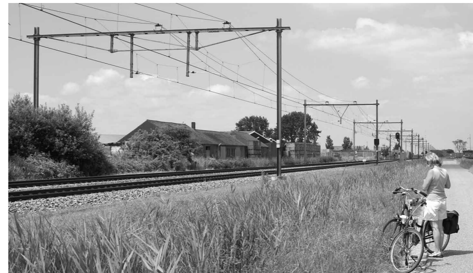
Vanaf de weg aan de noordoostzijde van de voormalige laad- en losplaats Oostdijk is aan de hand van het brede bovenleidingportaal de plek te herkennen, waar het wissel heeft gelegen naar de eigenlijke laad- en losweg. De oude opslagloodsen zijn nog steeds aanwezig. 22 juli 2012.