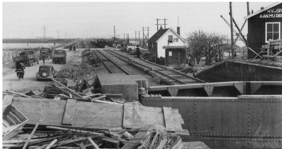
Vanaf de dijkcoupure bij Oostdijk zien we op de dijk een keet van het aannemersbedrijf Van Splunder uit Ridderkerk, iets verderop wachterswoning 28 met daarbij de tijdelijke post T en het wekkersein voor de overweg, en voorbij de overweg het weegbrughuisje. Foto J. Lub, 11 april 1953. Uit: J. Matthijssen, Sporen door het water, De Nederlandse Spoorwegen en de Watersnoodramp van 1953.

Na de watersnoodramp van 1 februari 1953 leek het baanvak Oostdijk – Kruiningen-Yerseke (km 34,6 – km 38,5) een speelbal van de golven te worden. Toch werd het zuidelijke spoor in ruim twee maanden tijd zodanig hersteld, verhoogd en met kistdammen verstevigd, dat op 5 mei 1953 de beide in Vlissingen opgesloten postrijtuigen