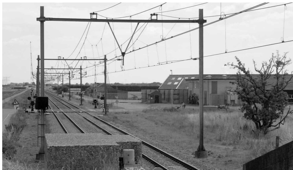
Vanaf de dijkcoupure aan de westzijde van de voormalige laad- en losplaats Oostdijk kijken we naar de plek, waarop wachterswoning 28 heeft gestaan. Voorbij de overweg staat na bijna zestig jaar nog steeds hetzelfde weegbrughuisje. Foto Marius Broos, 22 juli 2012.

Op 2 juni 1953 waren de deuren open van 14.00 tot 15.45 uur. Voorafgaand aan het vertrek van trein 5128 (de zandtrein) om 14.06 uur liep een losse locomotor om het eventueel bij de laatste vloed achter gebleven wrakhout van