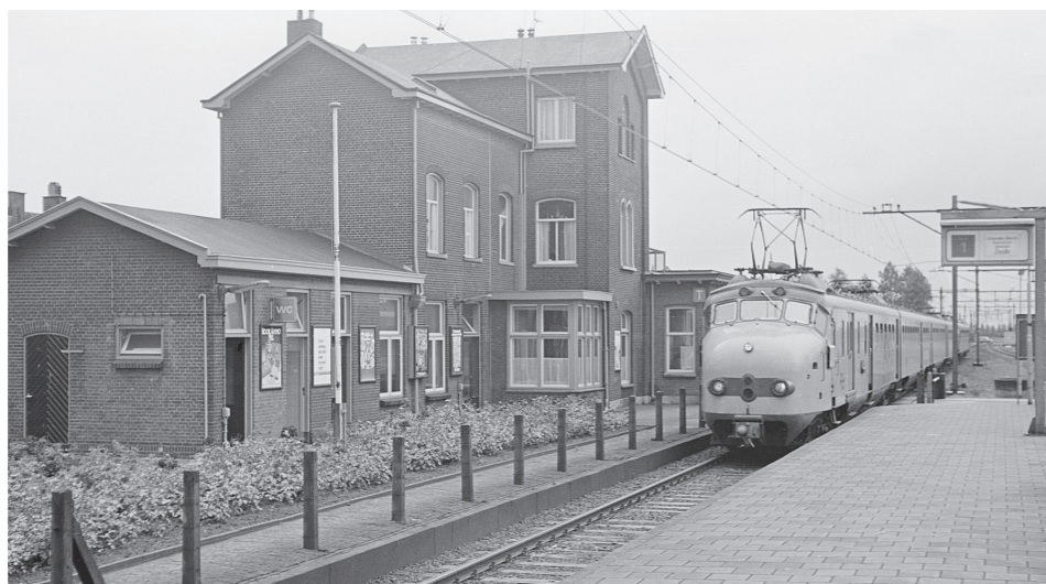
De treinstellen NS 712 en 386 stoppen als trein 4640 (Vlissingen – Zwolle) in Kruiningen-Yerseke. Foto Marius Broos, 31 juli 1976.

vleugel, die even hoog was als het bestaande rechterdeel. Gelijkvloers lag hierin de wachtkamer 3 e klasse, terwijl de verdieping bedoeld was als vergroting van de stationschefswoning. In juni 1892 kwam de stationsnaam Kruiningen-Yerseke in zwang. (Per 1 mei 1911 werd dat Kruiningen-Ierseke en per 29 september 1957 veranderde dat weer in Kruiningen-Yerseke.) In 1902 werd de wachtkamer 3 e klasse vergroot en in 1920 kreeg het middendeel van het stationsgebouw bij onderhandse aanbesteding een extra verdieping. In 1913 werd de beveiliging (bestek 1373 SS, 1914) verbeterd, waarbij een blokpost ontstond in een uitbouw van het middendeel aan de perronzijde. Aan de zijde Krabbendijke kwam een afstandssein met voorsein te staan en een bordesseinpaal met twee uitrijseinen. Aan de andere kant waren dat twee uitrijseinen, tevens blokseinen.