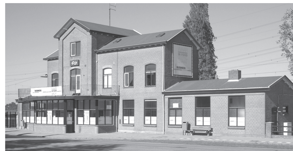
Gezicht op de straatzijde van het stationsgebouw te Kruiningen-Yerseke. Duidelijk zijn het hogere middendeel uit 1920 en rechts de verschillende uitbreidingen uit 1891 en 1902 te onderscheiden. Foto Marius Broos, 10 oktober 2010.