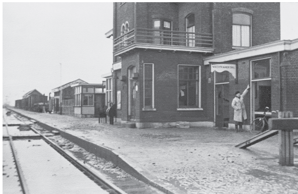
Zo hoog stond het water op 1 februari 1953! Tussen 1 februari 1953 en 3 augustus 1953 was er geen reizigersvervoer mogelijk tussen Krabbendijke en Kruiningen-Yerseke en vanaf die datum tot 16 januari 1954 slechts over enkel spoor. De gevolgen van de watersnoodramp voor het houtwerk en de muren bleven nog lang zichtbaar aan het gebouw. Aan de westzijde van het stationsgebouw lag de wachtkamer (1 e en 2 e klasse uit 1891, de blokpost uit 1913 en verderop staat het retiradegebouw uit 1863.

Bij de aanleg van de Zeeuwse spoorweg had Kruiningen een nagenoeg uitsluitend agrarische bevolking. De inwoners van Yerseke hielden zich vooral bezig met de schelpdierencultuur. Het was niet meer dan logisch dat het station werd geprojecteerd aan de Zanddijk met zijn hoge kruin als belangrijkste weg tussen de twee dorpen. Een meer zuidelijk of noordelijk gelegen plek schijnt nog wel een punt van discussie te zijn geweest, maar een vast uitgangspunt bleef het haaks kruisen van het kanaal door Zuid-Beveland. Aanvankelijk was Kruiningen een echte plattelandshalte, waar enkele treinen stopten voor het opnemen of uitlaten van slechts weinig reizigers. Per 31 december 1886 kwam op de Zeeuwse lijn het tweede spoor tussen Bergen op Zoom en Kruiningen gereed. De emplacementen onderweg werden enige tijd later aangepast. In 1891 kreeg het stationsgebouw in Kruiningen (bestek 531 SS, 1890) aan weerszijden een aanbouw. Links was dat een lage vleugel met een wachtkamer 1 e en 2 e klasse en rechts een hoge