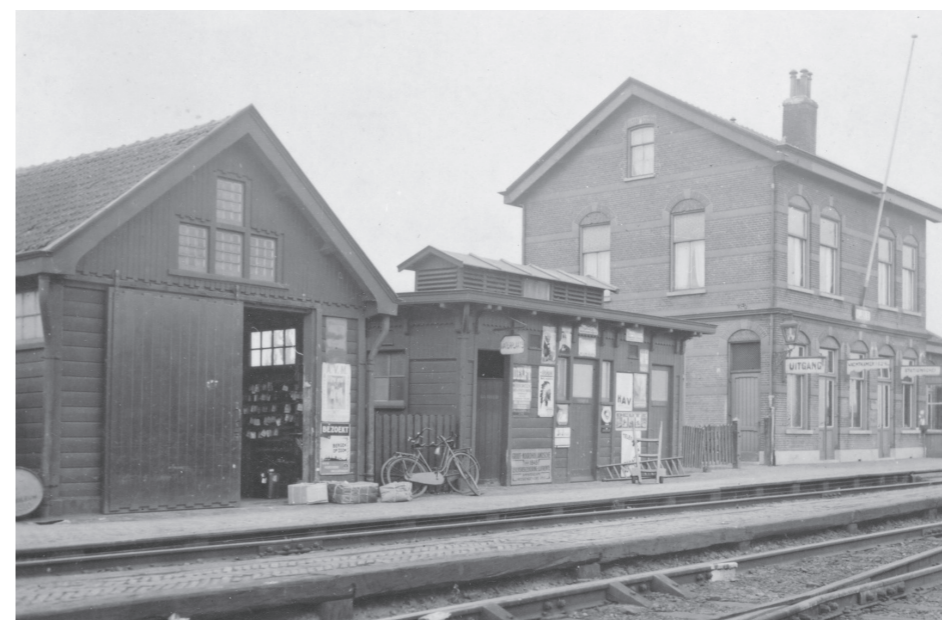
Het stationsgebouw van Vlake (perronzijde). Links staan de goederenbergsplaats en het privaatgebouw uit 1911. Foto uit circa 1925, collectie Marius Broos.