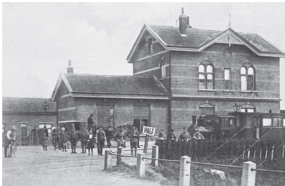
Het stationsgebouw van Vlake (straatzijde). De stoomtram naar Hansweert staat gereed voor vertrek. Links staan de dienstwoningen uit 1912. Ansichtkaart uit circa 1915.

Het baanvak Bergen op Zoom – Goes van de Zeeuwse lijn werd op 1 juli 1868 in gebruik genomen. Ruim twee jaar later, op 1 augustus 1870, liet de SS aan de oostzijde van het Kanaal door Zuid-Beveland (pal vóór de draaibrug) enkele treinen stoppen voor het in- en uitlaten van reizigers. Deze halte op (tijdig) verzoek stond bekend als Vlake en had alleen betekenis als overstapplaats voor reizigers naar en van Zeeuws-Vlaanderen. Aanvankelijk moesten zij zich op eigen gelegenheid van Vlake naar de buitenhaven van Hansweert begeven. Van daaruit was het dan mogelijk om over te varen naar Walsoorden, Hoedekenskerke of Vlissingen. In 1879 ontstond er een particuliere veerdienst Vlake – Hansweert – Walsoorden, waarvoor reizigers zich al meteen bij de halte konden inschepen. Maar omdat het passeren van de schutsluis bij Hansweert te veel tijd kostte, ging er in 1880 een paardenomnibus rijden tussen Vlake en Hansweert (buitenhaven). De zaken gingen goed. In 1882 werd Vlake een vaste halte en in 1886 kwam er een haltegebouw (km 40,256 Rsd-Vs, bestek 427 SS) tot stand. In 1901 werd het eerste perron van een bestrating voorzien en het tweede perron met 20 meter verlengd. Een jaar later kreeg het haltege-