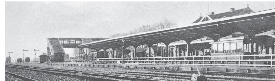
De voetgangersbrug in Goes verbond drie perrons met elkaar, circa 1930. Het derde perron was niet overdekt. Ansichtkaart, collectie Marius Broos, Roosendaal.

Tot 1900 waren er geen grote wijzigingen. Pas in 1902 werden de perrons verlengd en verhoogd. Het tweede perron kreeg zelfs een overkapping (bestek 909 SS). Dat het er in 1903 nog vrij primitief aan toeging, blijkt uit het opnieuw bestraten van de toegangsweg en het stationsplein. Ook werden in de goederenloods twee