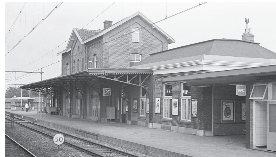
Stationsgebouw te Goes, 31 juli 1976. Rechts bevond zich de vroegere wachtkamer 1 e en 2 e klasse, alsmede de wachtkamer 'Niet Rookten', destijds speciaal bestemd voor dames (van de betere stand). Goes was nog een echt stadje. Duidelijk is de dakconstructie te zien: een in het midden afgeplat schilddak.