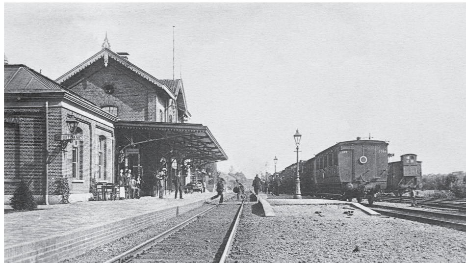
Stationsgebouw te Goes, circa 1910. Links bevindt zich de wachtkamer 3 e klasse. Een stoptrein in de richting Roosendaal staat gereed voor vertrek. Onder het toezien van de stationschef haast een reiziger zich nog via het overpad naar zijn trein. Ansichtkaart, collectie Marius Broos, Roosendaal.

Al in 1873 kwam er een eerste uitbreiding (bestek 73 SS). Romers vervolgt: 'Het stationsgebouw wordt aan weerszijden met een naar verhouding zeer grote wachtkamer vergroot. Deze wachtkamers zijn vierkant en staan opvallend naar voren. Zij hebben een in het midden afgeplat schild-