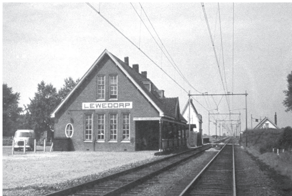
Gezicht vanuit het oosten op het voormalige haltegebouw van Lewedorp (1916-1964) bij km 59,134. Verderop zijn te zien: links dijkcoupure, overweg Toldijk en dienstwoning, en rechts wachterswoning 53. Foto uit circa 1960.

Per 1 juni 1887 werd bij het dorpje Noord Kraaijert en ongeveer halweg 's-Heer Arendskerke en Arnhemuiden een halte (km 59,2 Rsd – Vs) voor reizigers- en goederenvervoer geopend. Het waren aanvankelijk niet meer dan twee perronetjes voor het opnemen en uitlaten van marktgangen naar Middelburg of Goes. Ze lagen iets ten westen van de overweg in de Toldijk (km 59,180) en de naastgelegen dijkcoupure (km 59,175). Een jaar later kwam ook het tweede spoor op het baanvak Goes – Middelburg in dienst. In eerste instantie stopten er alleen op marktdagen in Goes en Middelburg treinen. Met ingang van de zomerdienstregeling in 1893 stopten er dagelijks in elke richting twee treinen, vandaar dat een jaar later naast wachterswoning 53 (km 59,198 rechts) een houtenabri uit Zwijndrecht aan de halte werd opgesteld. Kennelijk was het in 1898 nodig hierin een schot aan te brengen om reizigers van elkaar te scheiden. In 1902 bleek deabri door het toenemende vervoer van marktgangen te klein, zodat in 1903 aan de zuidzijde van de lijn, pal tegenover wachterswoning 53, een stenen wachverblijf met bureau, bergplaats en retirade werd gemaakt (km 59,198 links). De oude houtenabri kreeg eenzelfde soort bestemming in Rilland-Bath voor treinen in de richting Vlissingen.