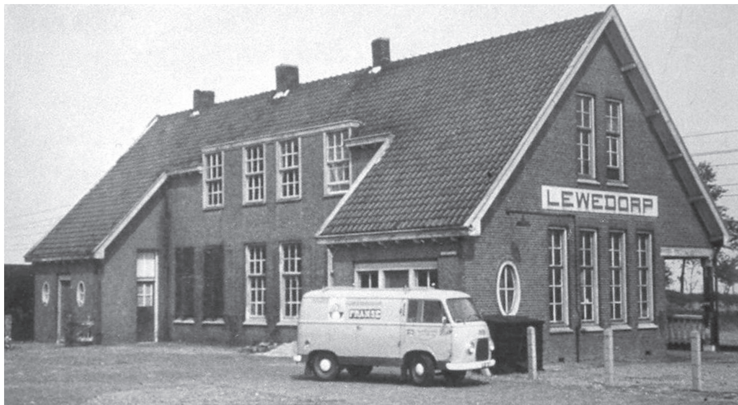
Gezicht vanuit het zuidoosten op het voormalige haltegebouw van Lewedorp. Het was voor Lewedorp een uit de kluiten gewassen gebouw. Foto uit circa 1960.

8, Kruiningen 6, Bergen op Zoom 3 en Roosendaal 3 bedevaartgangers, totaal alzo 290.' Een jaar later volgde de tweede bedevaart, maar vervolgens maakte de Eerste Wereldoorlog tot 1920 elke bedevaart naar Duitsland onmogelijk. Of het succes van 1912 en 1913 één van de redenen was Noord Kraaijert een heus haltegebouw te geven, blijft onbekend. Maar een feit is, dat in 1914 begonnen werd met het maken van nieuwe perrons (km 59,1 Rsd – Vs) en een laad- en losplaats met bijbehorend spoor aan de zuidzijde, aanvankelijk bereikbaar vanuit