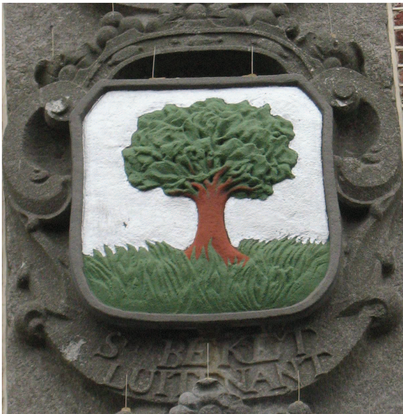
Wapen van Samuel Beket op de gevel van De Doelen te Sommelsdijk