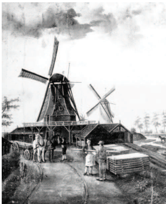
Foto van een geschilderd schoorsteenstuk, dat zich in Historisch Museum De Bevelanden bevindt. De molen op de voorgrond is De Eendracht, rechts is korenmolen De Vijf Gebroeders.