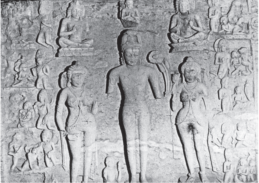
Afbeelding van Mithuna in de Canarin-tempel op Salsetta.

Na zijn bezoek aan Salsetta voer Berse naar Chaul, waar hij de Elephanta-grotten bezocht. Deze vormden een rotstempel gewijd aan Sjiwa en zijn gezellin Parvati: