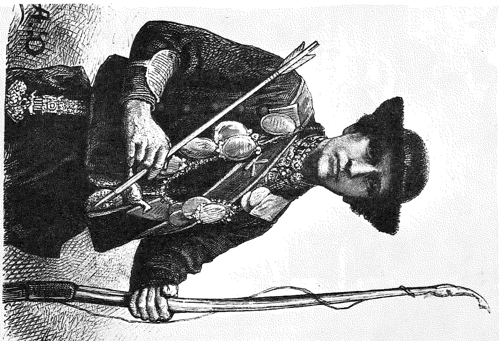
De schutterskoning (1874). Houtgravure naar een tekening van Adolf Dillens.

Jan had het geluk den eersten prijs te winnen, en wel een gouden „schuufink” voor den halsdoek. De halsdoek namelijk wordt met een knoop vastgemaakt, waarboven bij de gegoeden een paar gouden »doorluchtige” (doorzigtig gewerkte) hemsdknoopen prijken; terwijl onderaan soms een lange gouden ring gescho-