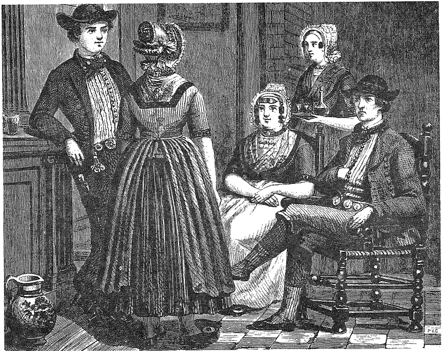
Jongeman komt zijn meisje voorstellen (c. 1850). Houtgravure naar Braet von Uberfeldt.