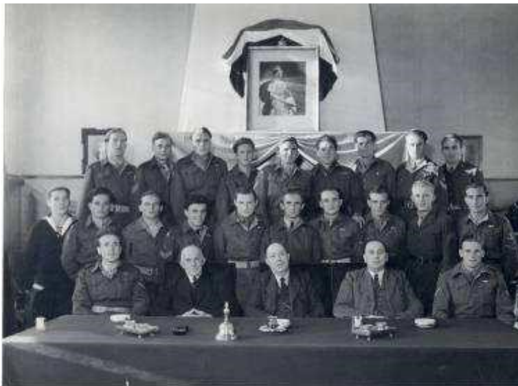
De huldiging van teruggekomen soldaten in 's-Heer Arendskerke rond 1950.

Nadat je de algemene literatuur hebt bestudeerd, en eventueel op de site van het museum in Nieuwdorp hebt gekeken, kun je een aantal onderzoeksvragen formuleren. Meest eenvoudig is om aan de hand van de adressen en de data een overzicht te maken van de betrokkenheid van de mannen uit Kapelle bij diverse conflicten. Met andere woorden: zaten ze bij de brandhaarden van het conflict, of hadden ze geluk dat ze in het buitengebied zaten? Lees brieven waarin over strijd tegen de opstandelingen wordt gesproken. Passen deze teksten in het algemene beeld van de strijd? Een andere invalshoek is om aan de hand van de namen van de brieverschrijvers te zoeken in Kapelle of sommigen van deze schrijvers nog in leven zijn. Misschien kun je ze interviewen over hun ervaringen. Er zijn namen bekend van enkele oorlogsveteranen uit Kapelle, die bereid zijn om te worden geïnterviewd.