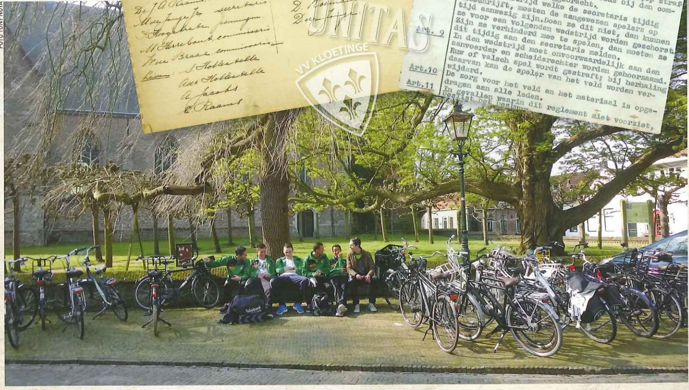
Het parkeerterrein voor de Geerteskerk dient voor een deel van onze voetballende jeugd nog iedere zaterdag als verzamelpunt bij uitwedstrijden. Een scala van fietsen en andere vervoermiddelen vormen dan het decor rond het bedehuis.