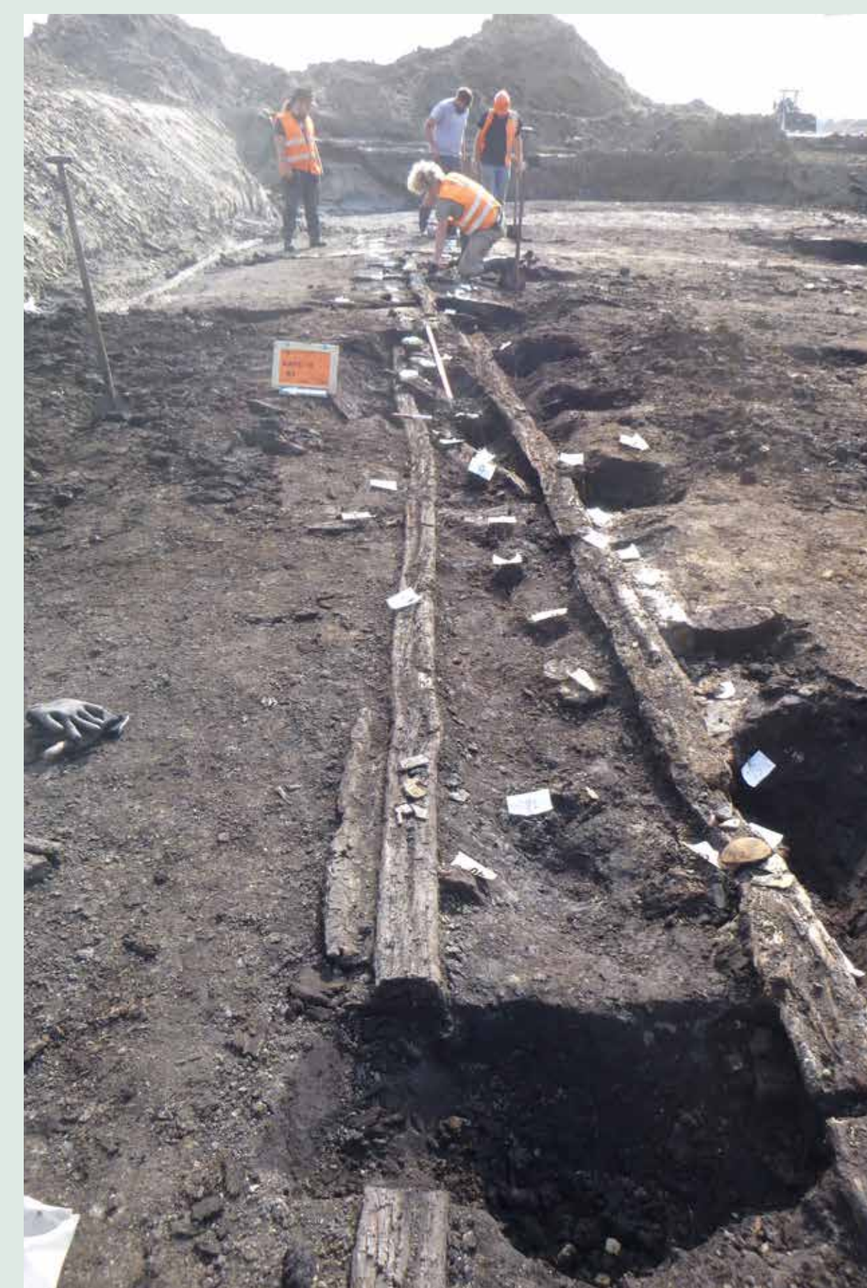
>> Opgraving Kapelle.