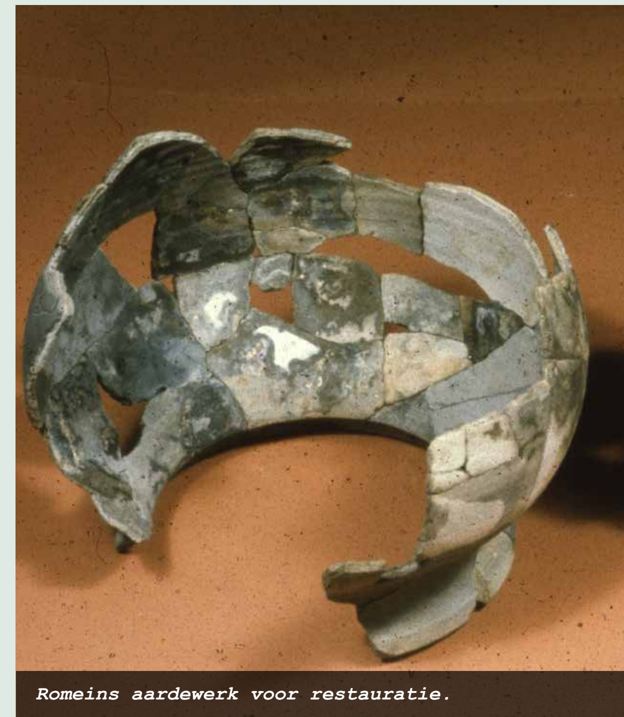
Romeins aardewerk voor restauratie.

Ten zuiden van de stad Goes komen vanaf de jaren 1950 bedrijventerreinen tot ontwikkeling. Die gaan, behalve het Marconigebied, allemaal De Poel heten. In 2022 begint de ontwikkeling van een nieuw gedeelte van het bedrijventerrein, gelegen tussen de al aangelegde bedrijven en het Poeldorp 's-Heer Hendrikskinderen. Bij archeologisch onderzoek komt er veel nieuwe informatie tevoorschijn over de bewoning en het gebruik van het Poelgebied. Reden genoeg om in de archeologie en de historie van het Poelgebied te duiken.