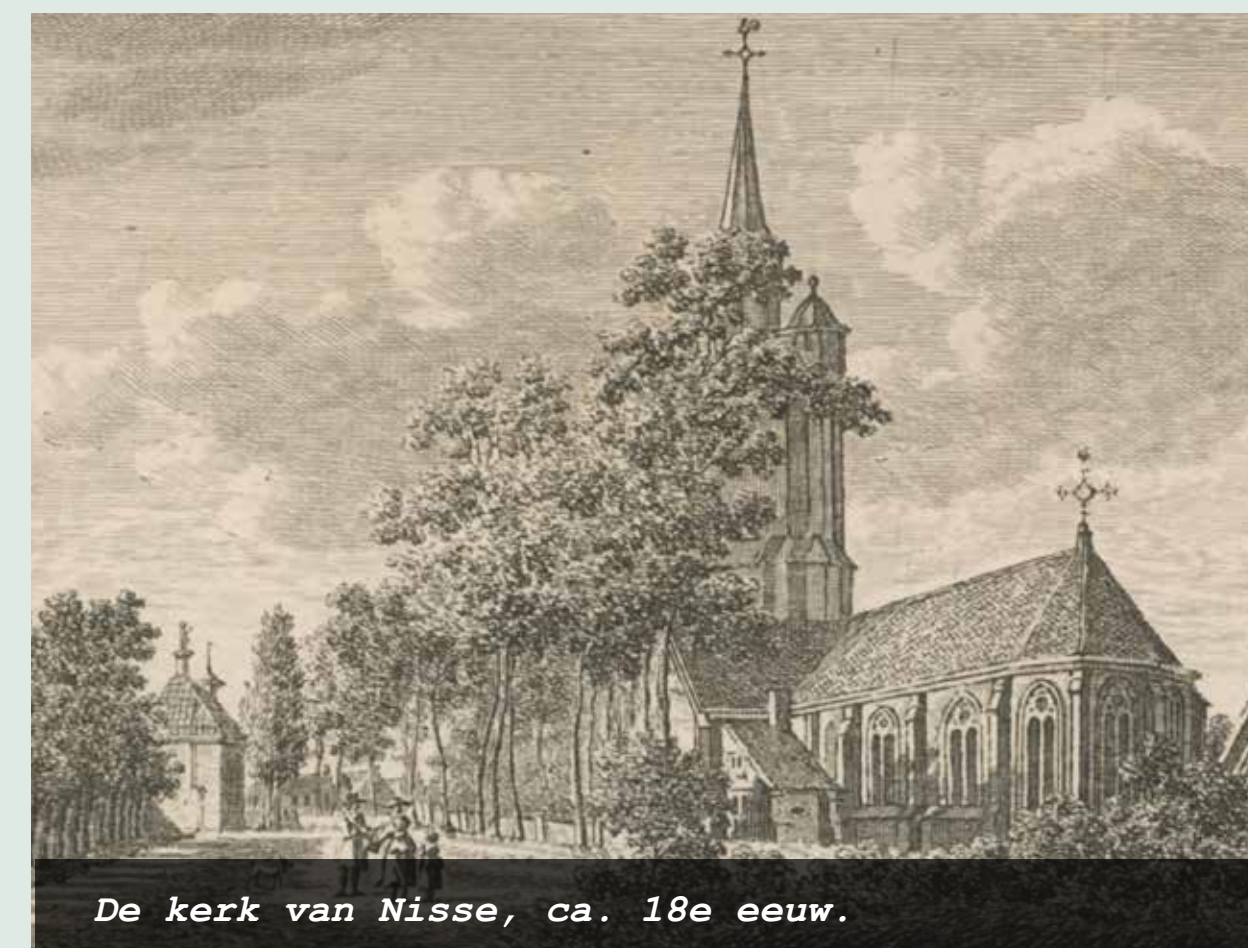
De kerk van Nisse, ca. 18e eeuw.