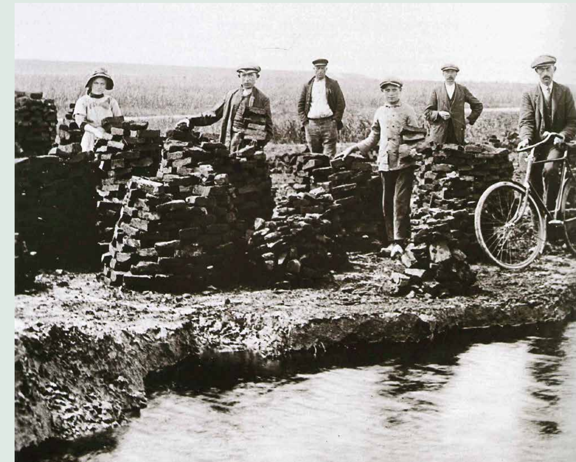
^ Turfwinning, Zuidhoek Schouwen, tijdens Eerste Wereldoorlog.