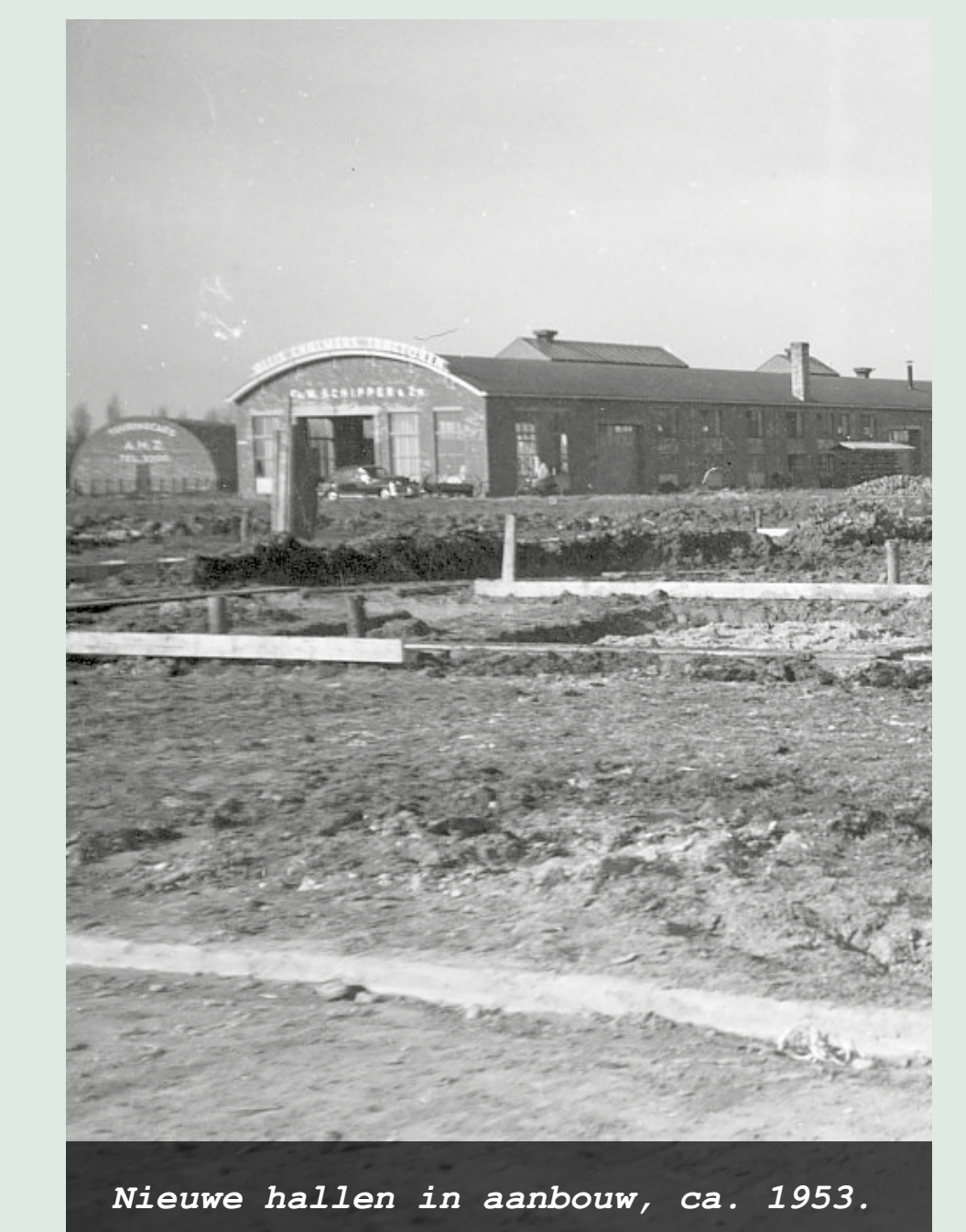
Nieuwe hallen in aanbouw, ca. 1953.