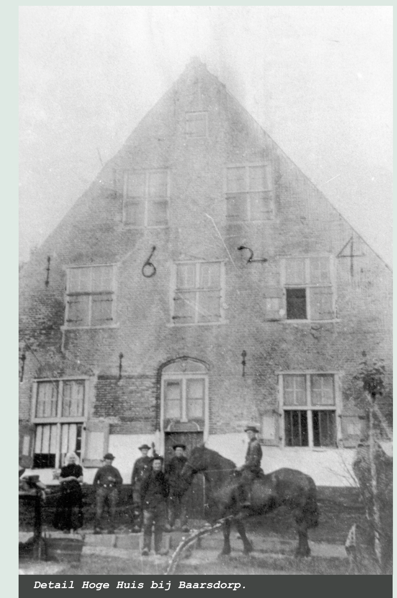
Detail Hoge Huis bij Baarsdorp.