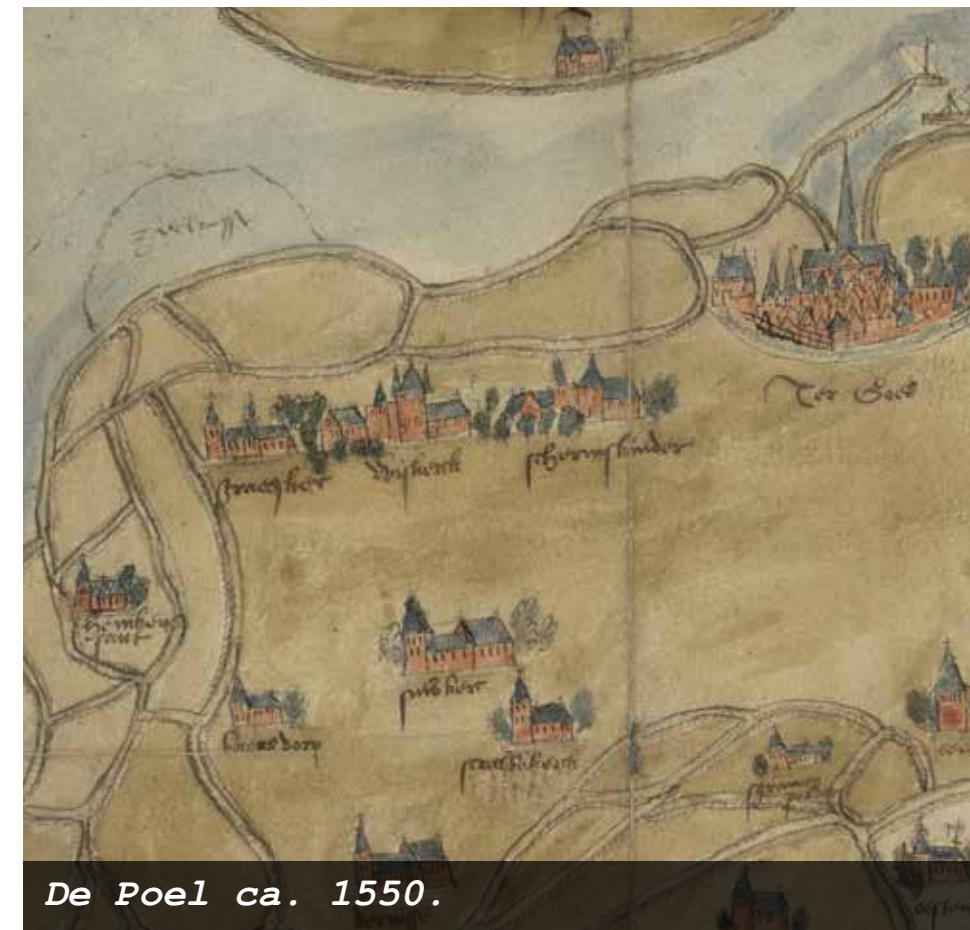
De Poel ca. 1550.

Na een overstroming in 1134 beginnen de overlevenden aan de aanleg van een ringdijk rond het Bevelandse kerngebied, die rond 1150 gereed is. Daarna komen de eerste parochies tot stand, de 'moeders' die aan de wieg van diverse dochterparochies staan. De ambachtsheren proberen elkaar vervolgens de loef af te steken met hun kerktorens, kerken en kastelen. Midden in het Poelgebied komen enkele dorpen tot stand waarvan de bewoners zich vooral op de