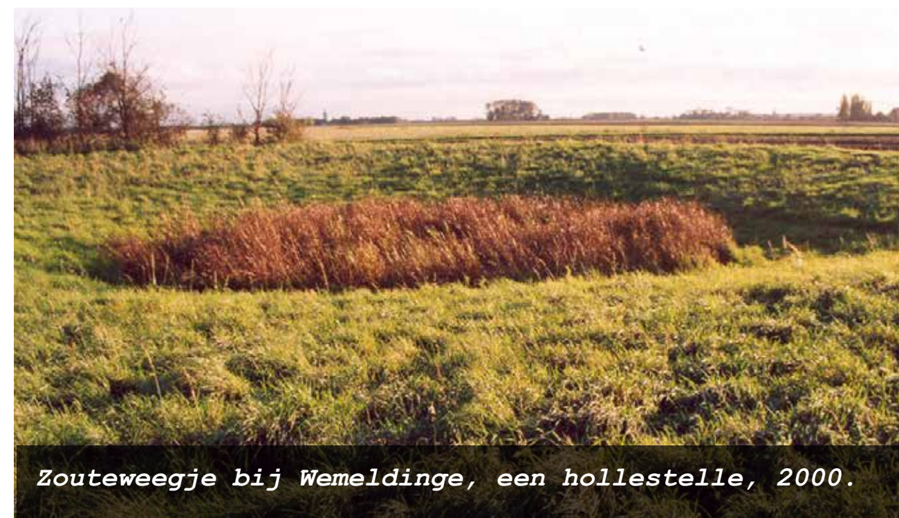
Zoutweegje bij Wemeldinge, een hollestelle, 2000.

zout en daarom ongeschikt om er gewassen op te laten groeien. De bewoners voorzien in hun onderhoud met melk en wol van schaapskudden. Omdat het land geheel boomloos is, gebruiken zij ter vervanging van hout een soort leem of turf als brandstof. 's Zomers kan deze leem uit hun weiden worden gestoken, als hier niet meer zoveel water op staat. Met houwelen hakken ze de leem of turf in