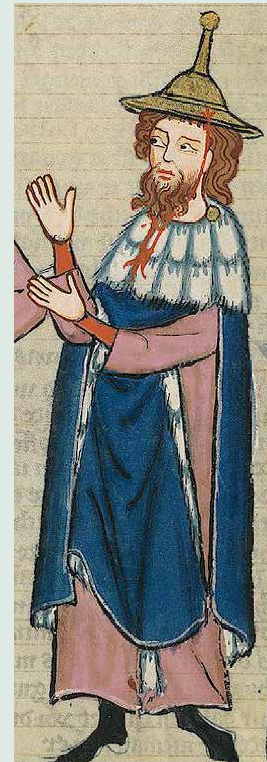
∨ Een Joodse man in de voorgeschreven hofkleding, uit het liedboek 'Codex Manesse', 1300-1340.