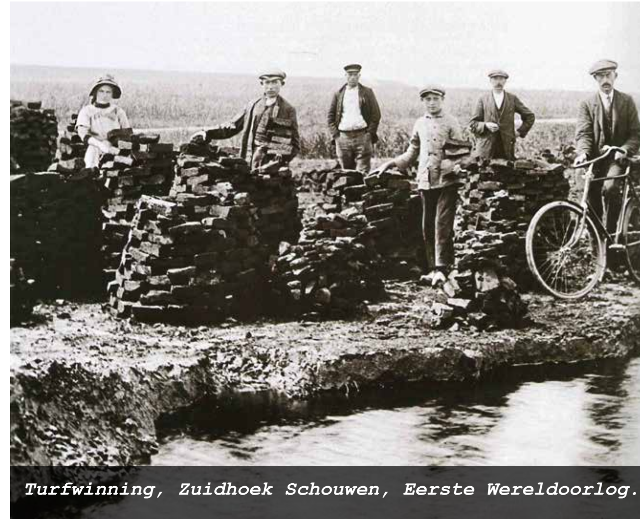
Turfwinning, Zuidhoek Schouwen, Eerste Wereldoorlog.

de vorm van blokken, en leggen die in de zon te drogen. Iedereen verzamelt deze blokken naar eigen behoefte. Als ze gedroogd zijn, wegen ze een heel stuk lichter. Als de blokken in het vuur worden gegooid, brandt dit precies zoals hout. De