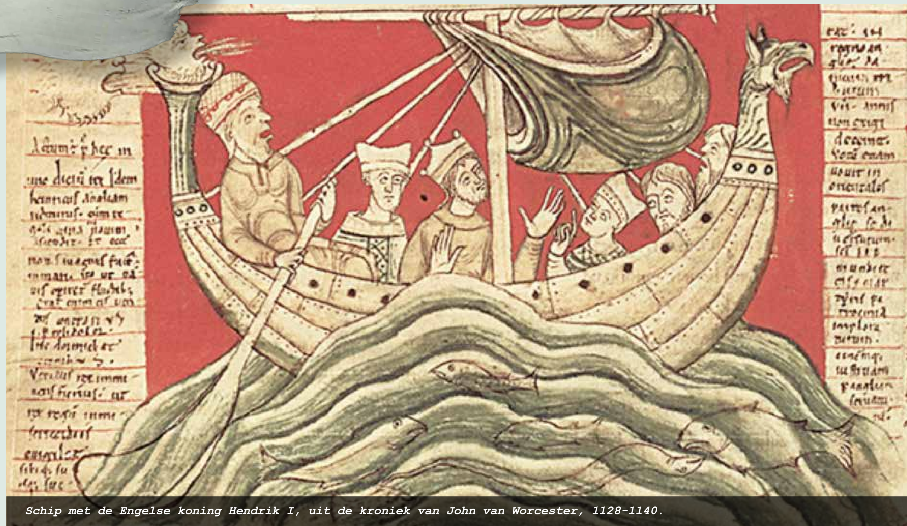
Schip met de Engelse koning Hendrik I, uit de kroniek van John van Worcester, 1128-1140.