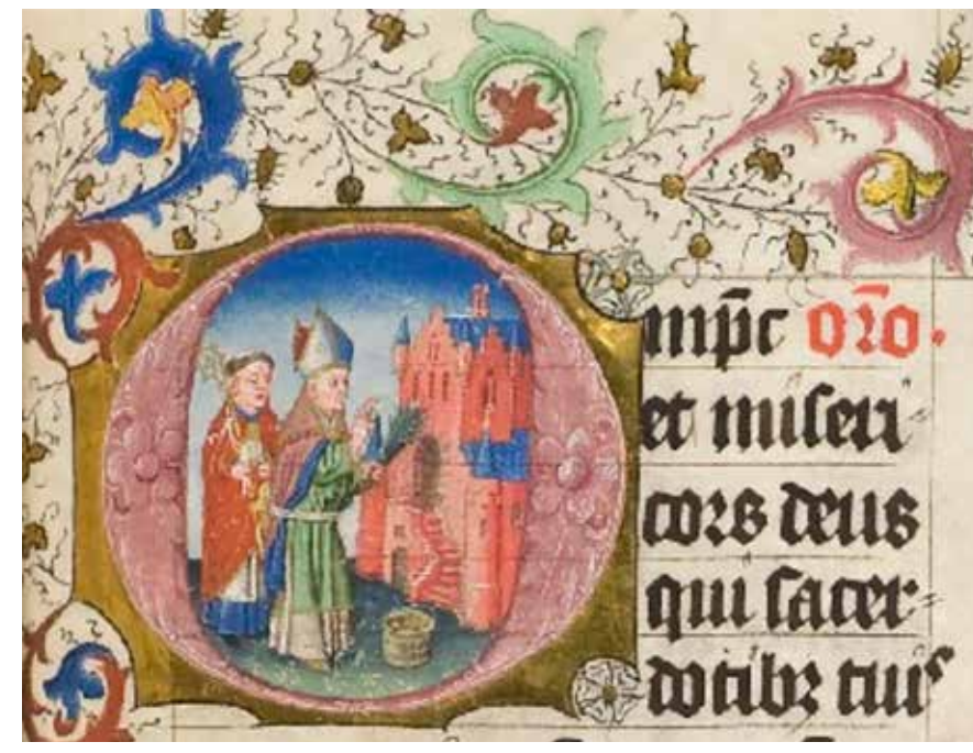
<< Het inwijden van een nieuwe kerk, miniatuur 15de eeuw.

Na het jaar 1000 strekken de Middelburgse parochies Westmonster (= Westkerk) en Noordmonster (= Noordkerk) zich met een grillige grens uit over gedeelten van de Bevelanden. Kort na 1150 worden Goes en Kloetinge zelfstandige parochies, dochters van de Noordmonsterparochie.