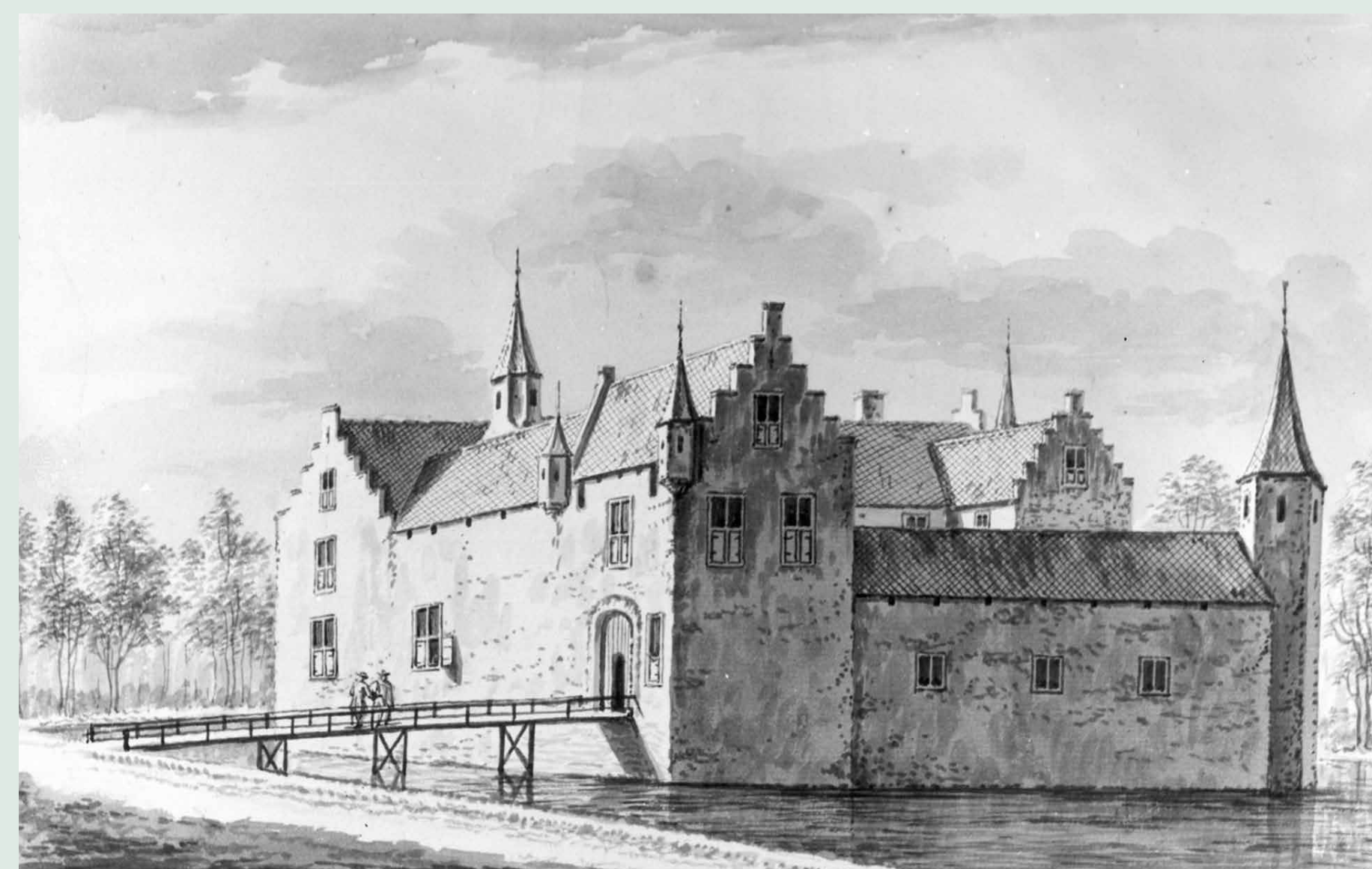
^ Het kasteel van 's-Heer Hendrikskinderen. Tekening A. Rademaker, ca. 1750.