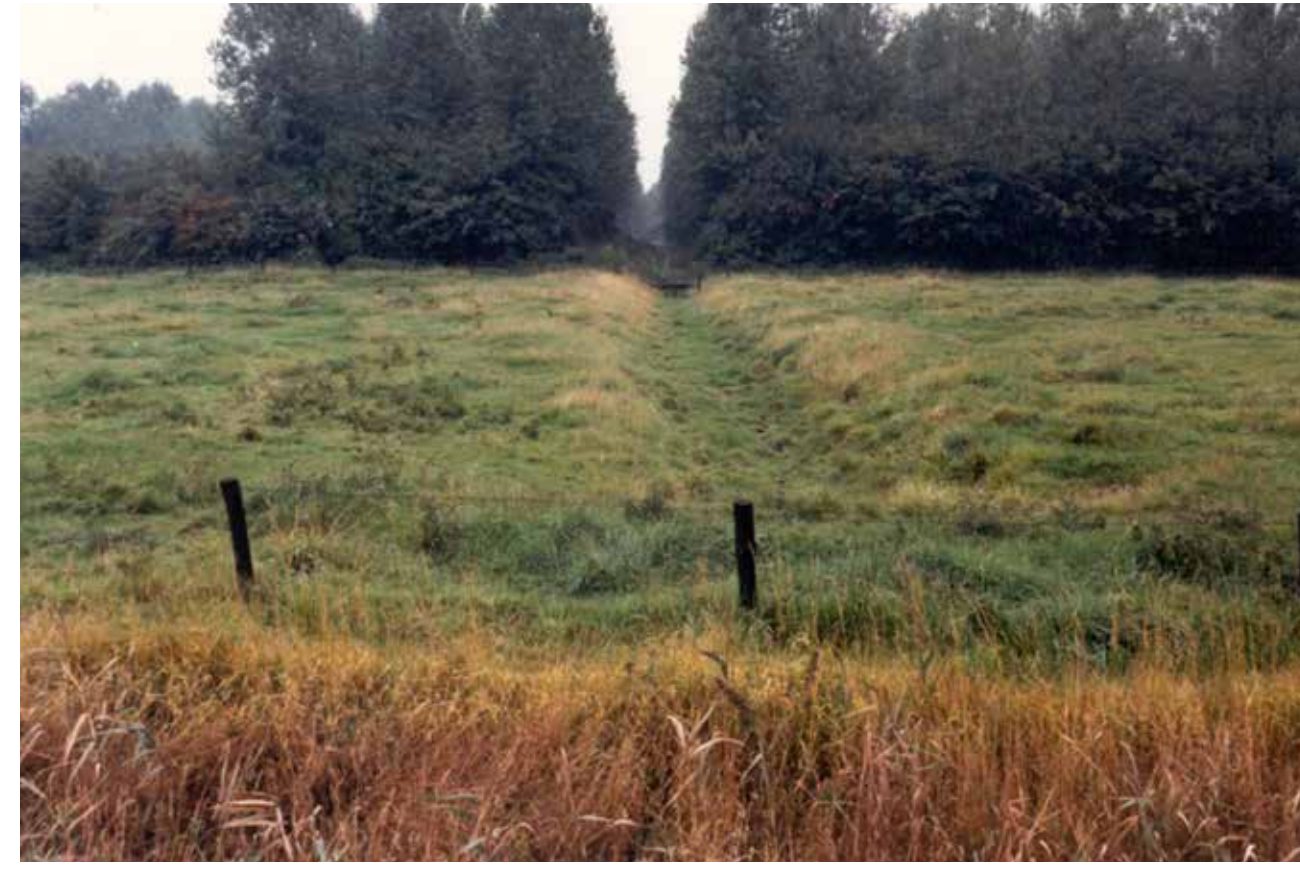
Mogelijke ligging van Wiksdorp in het Poelbos, 1986

(Sinoutskerke, Baarsdorp). Wiksdorp verdwijnt. Andere Poeldorpen zoals Nisse en 's-Heer Abtskerke houden het hoofd boven water. De kerken van deze dorpen blijven hun oorspronkelijke middeleeuwse karakter behouden.