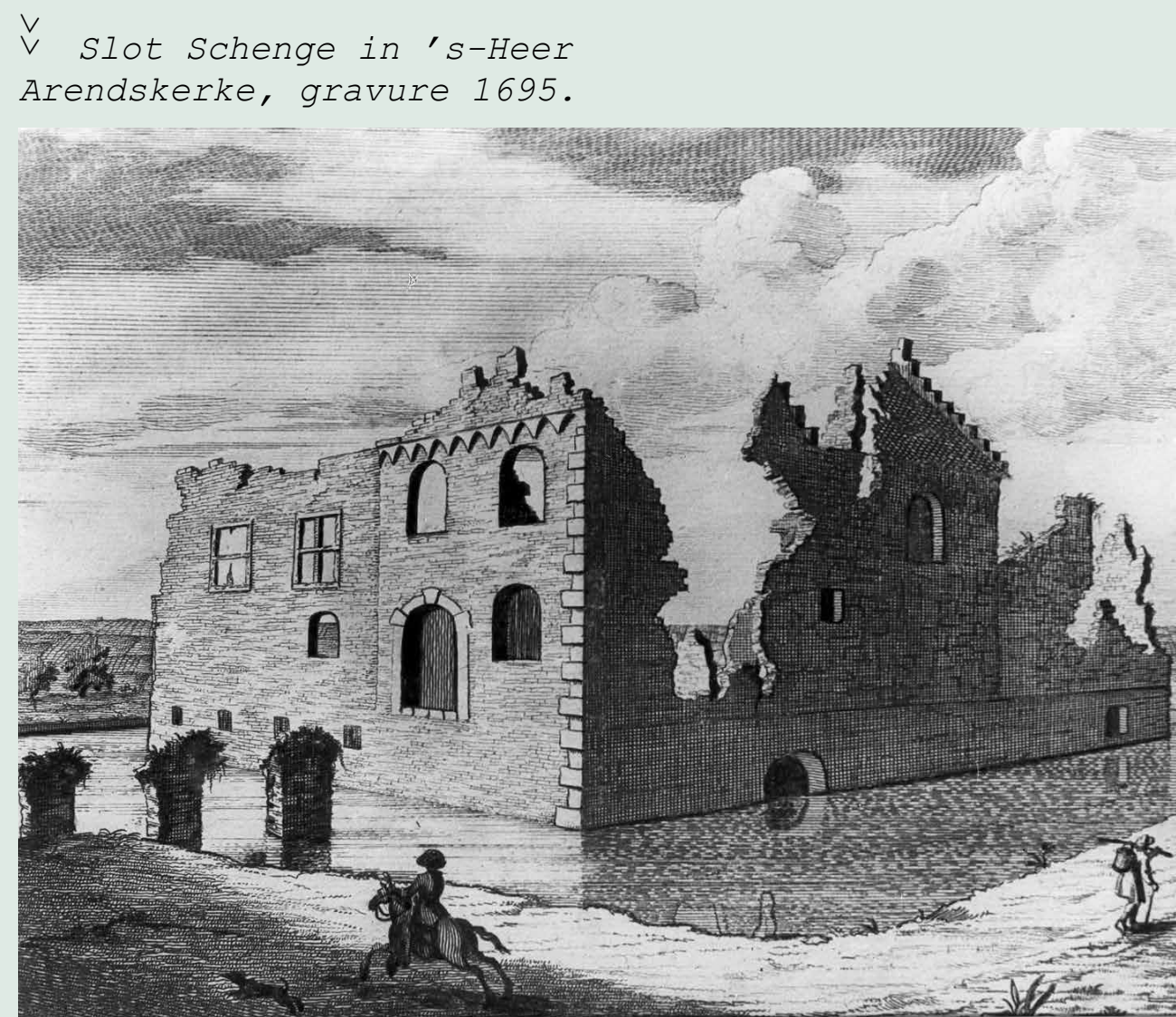
√ Slot Schenge in 's-Heer Arendskerke, gravure 1695.