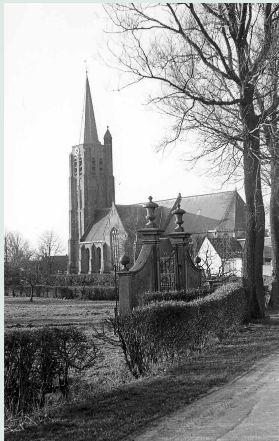
<< De kerk van Nisse met de overgebleven poort van het vroegere Slot van Nisse. Foto Collectie Bitter-van Opstal 1960.

zich met enkele dorpen en de gelijknamige ambachtsheerlijkheden. Meestal wordt de titel van ambachtsheer gekocht. Een familie Egter verbindt zich met Wissekerke. Een grafkelder uit de zeventiende eeuw is op de plaats waar de kerk heeft gestaan, bewaard gebleven.