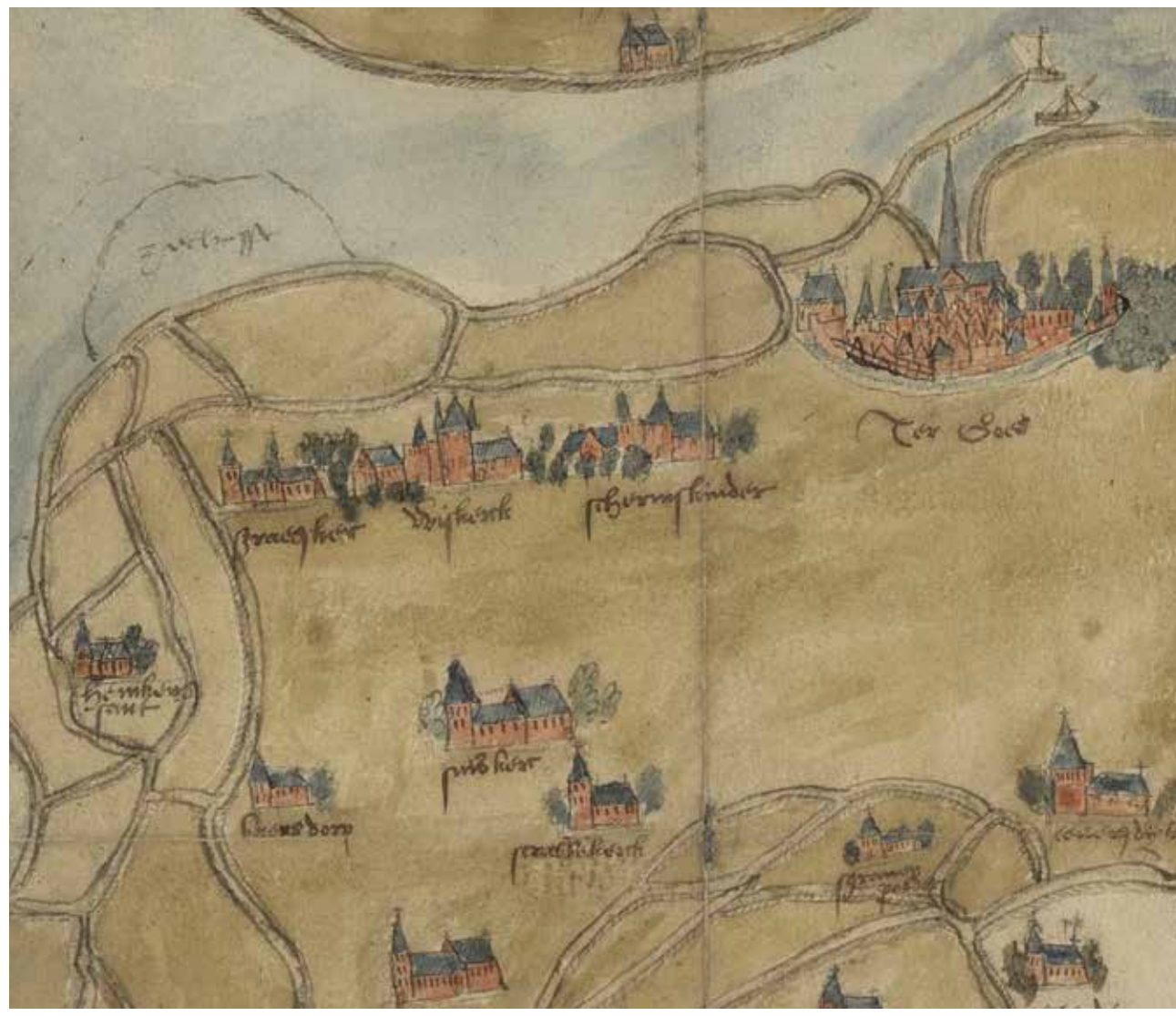
De Poel ca. 1542 of 1543, Cornelis van Zuerendonck sr., ARA Brussel, fam.archief Overschie de Neerjssche.

De woonkernen op de kreekkrug ontwikkelen zich tot dorpen en Goes ontwikkelt zich tot stad (1405). Nederzettingen in het Poelgebied groeien niet meer, maar blijven soms verbazingwekkend lang bestaan