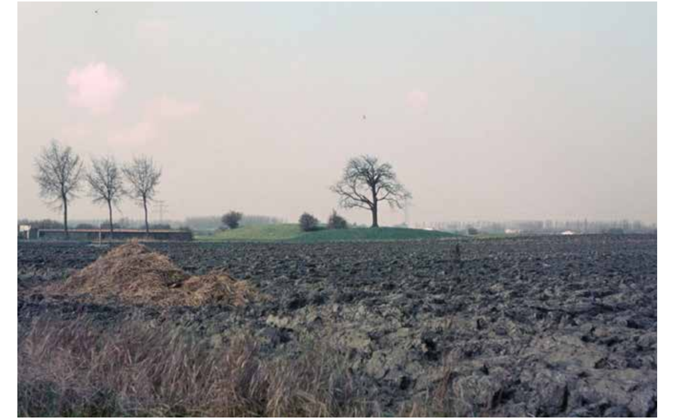
De kasteelberg bij Baarsdorp. Foto Gemeentearchief Borsele 1971

Geleidelijk aan verbetert het wegnennet in de Poel, wat vooral neerkomt op het verharden van de kronkelige wegen die op vroegere kreekjes zijn aangelegd. Belangrijke families verbinden