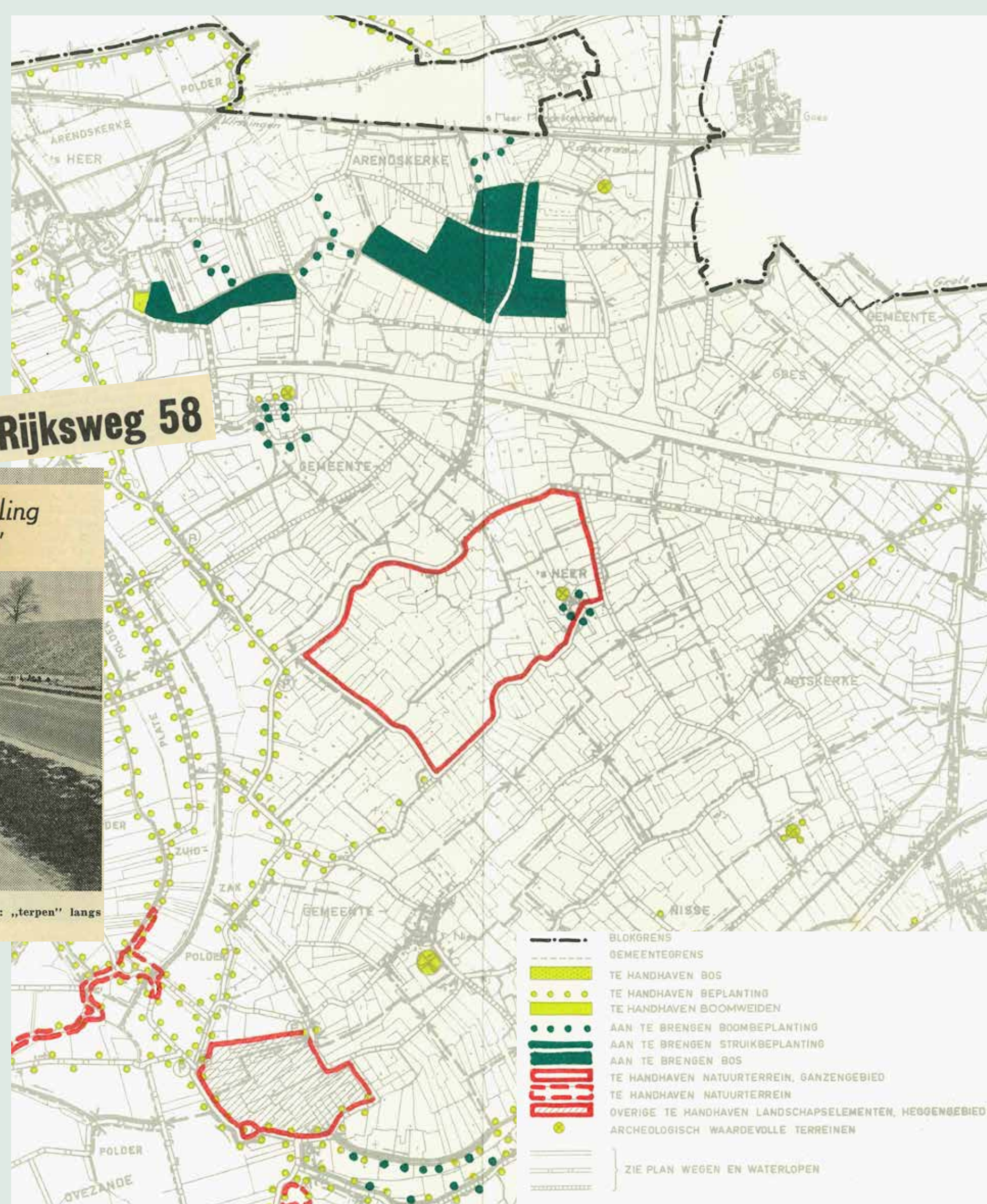
Bestaande en nieuwe natuur in het ruilverkavelingsgebied, rapport 1970.