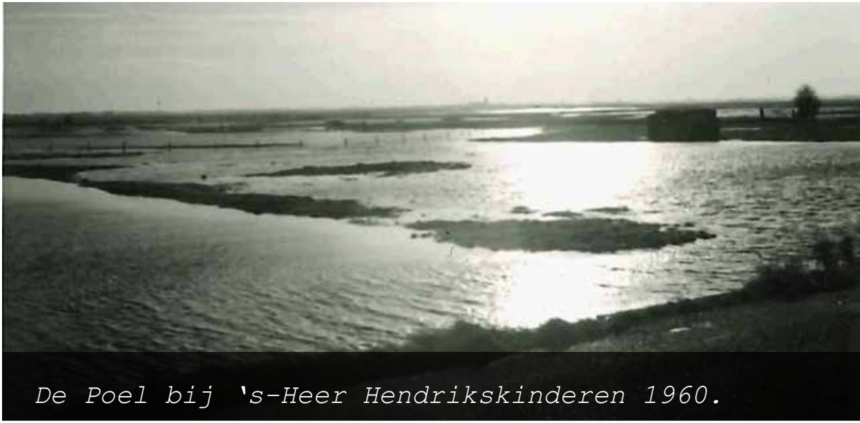
De Poel bij 's-Heer Hendrikskinderen 1960.

De Poel ondergaat in een periode van zestien jaar (1965-1981) een grote verandering: de ruilverkaveling. Het oude gebied wordt door een moderne bril bekeken en ondergaat een metamorfose. Nieuwe ontwikkelingen maken deze wijzigingen noodzakelijk.