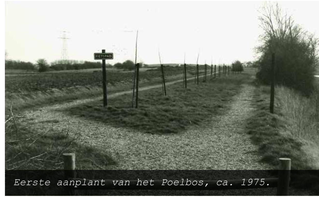
Eerste aanplant van het Poelbos, ca. 1975.

Het Poelgebied met de oude grillige sloten en perceelsvormen krijgt nieuwe wegen en percelen. Met de grond van zestien bedrijven, waarvan de eigenaren naar de Flevopolders verhuizen, kunnen nieuwe en veel grotere percelen worden gemaakt. De afwatering zal in de toekomst naar de Westerschelde gaan lopen.