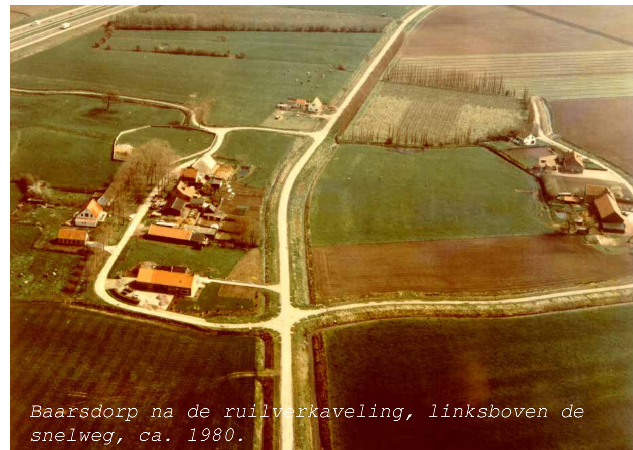
Baarsdorp na de ruilverkaveling, linksboven de snelweg, ca. 1980.

Waterschap en landbouworganisaties nemen het voortouw. Nieuwe ontwikkelingen zijn de aanleg van een nieuwe vierbaansrijksweg (A58) en de geplande afdamming van de Oosterschelde. De ontwikkeling van het Sloegebied brengt meer vrachtverkeer op de Zeeuwse weg. Ook de recreatie per auto komt tot ontwikkeling. De hoge waterstanden in de herfst en de winter, die van De Poel soms een moeras maken, behoren tot het verleden.