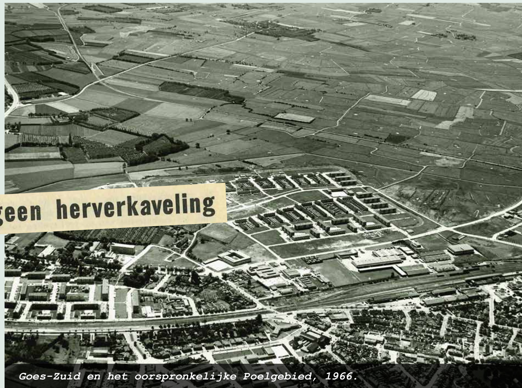
Goes-Zuid en het oorspronkelijke Poelgebied, 1966.

Een ruilverkaveling is geen herverkaveling