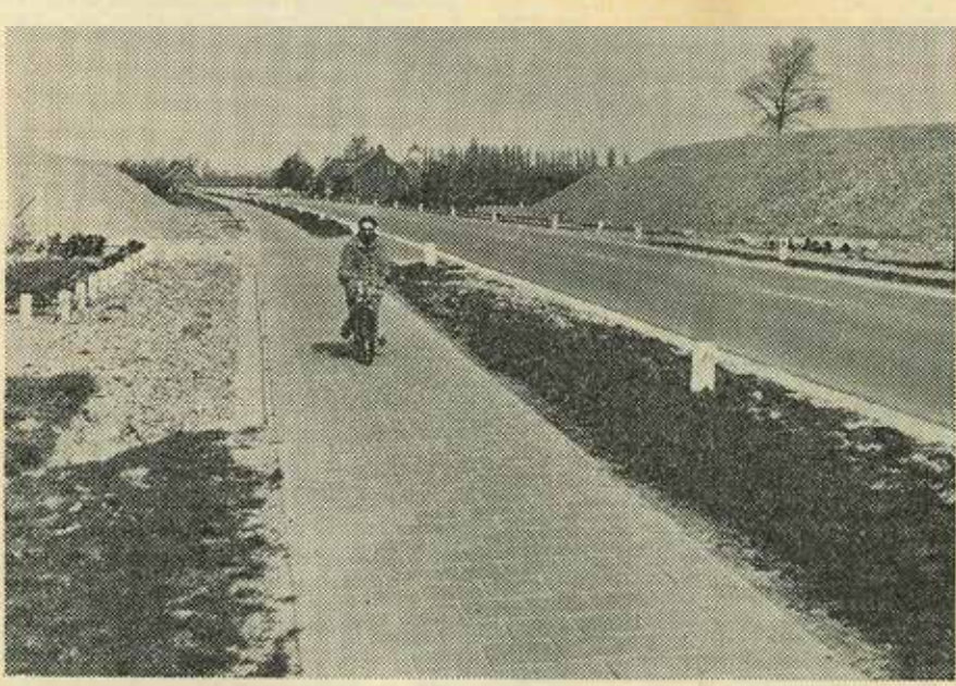
Eerste stadium van uitvoering van de nieuwe Rijksweg 58: „terpen” langs de te ontgraven rijksweg in de gemeente Blesdijk.

Nog dit jaar begin van aanleg Rijksweg 58 12,7 km ligt in ruilverkaveling „De Poel-Heinkenszand”