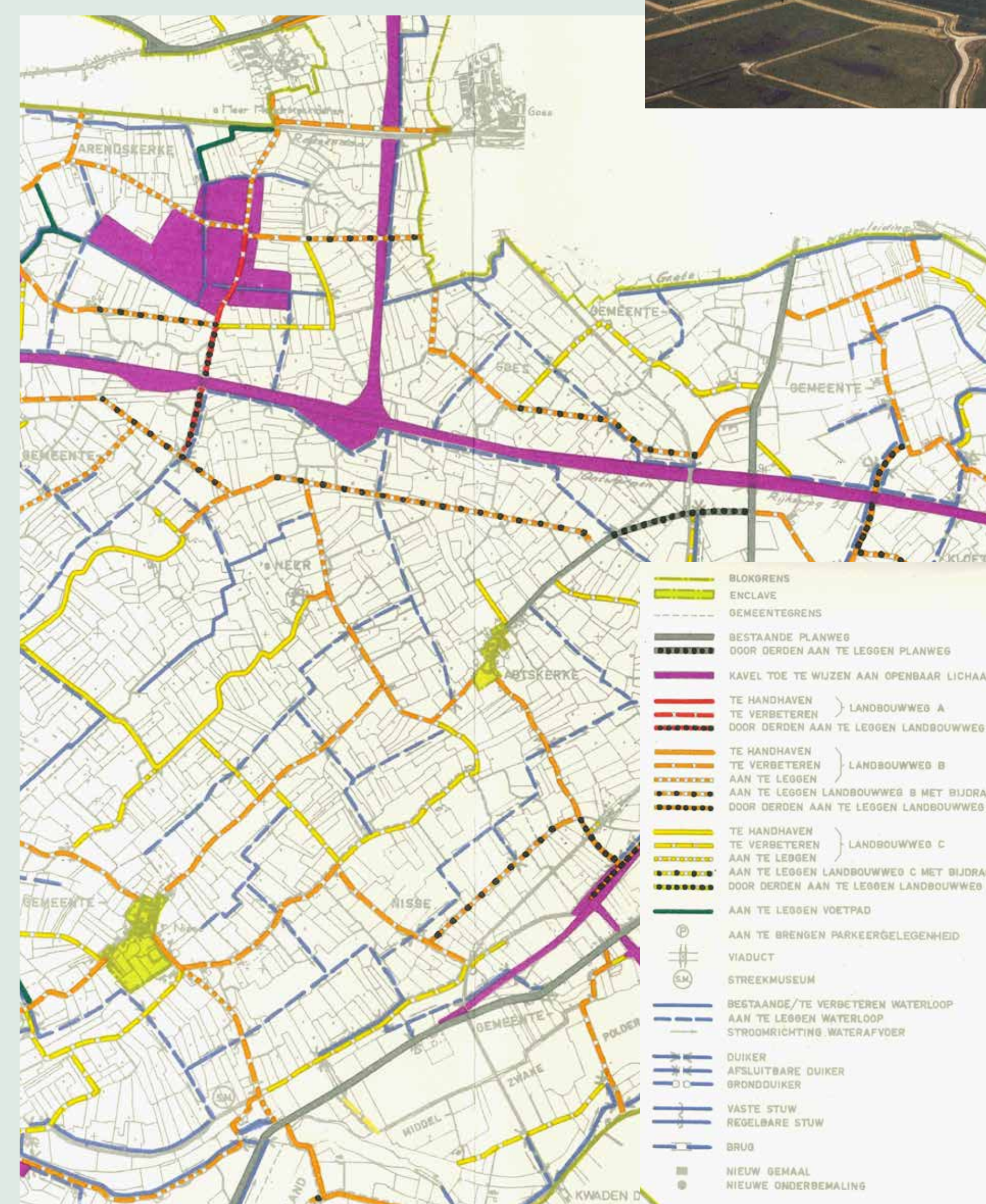
De verkaveling, nieuwe wegen en nieuwe sloten in het ruilverkavelingsgebied, rapport 1970.