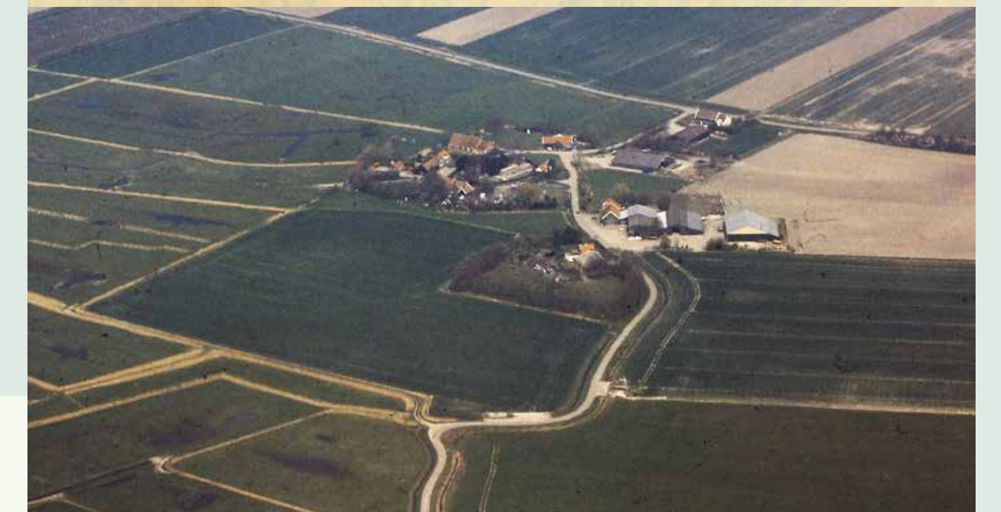
Het gehucht Sinoutskerke na de ruilverkaveling, 2002.

Ruilverkaveling „De Poel-Heinkenszand” vlot van start