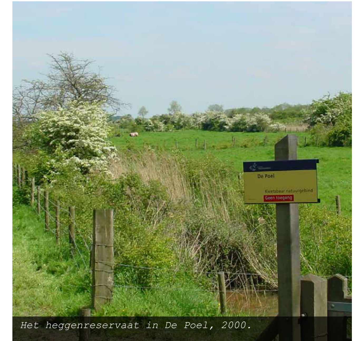
Het heggenreservaat in De Poel, 2000.

Poel, eliminatie of conservatie', en in Provinciale Staten. Sommige boeren gaan over tot het illegaal rooien van heggen. Daarna vinden er kleine aanpassingen aan het plan plaats.