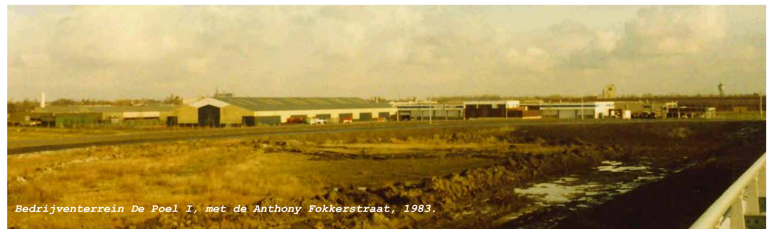
Bedrijventerrein De Poel I, met de Anthony Fokkerstraat, 1983.

als de dr. A.F. Philipsstraat en de Anthony Fokkerstraat lopen vol. Geleidelijk aan komen steeds meer bedrijventerreinen tot ontwikkeling, die De Poel I tot De Poel IV gaan heten. Ze bevinden zich ten westen van de jaren-zestig-woonwijk Goes-Zuid. Ze strekken zich naar het zuiden uit tot de A 58, terwijl de westgrens de Deltaweg (A 256) is.