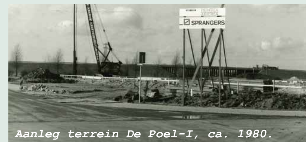
Aanleg terrein De Poel-I, ca. 1980.