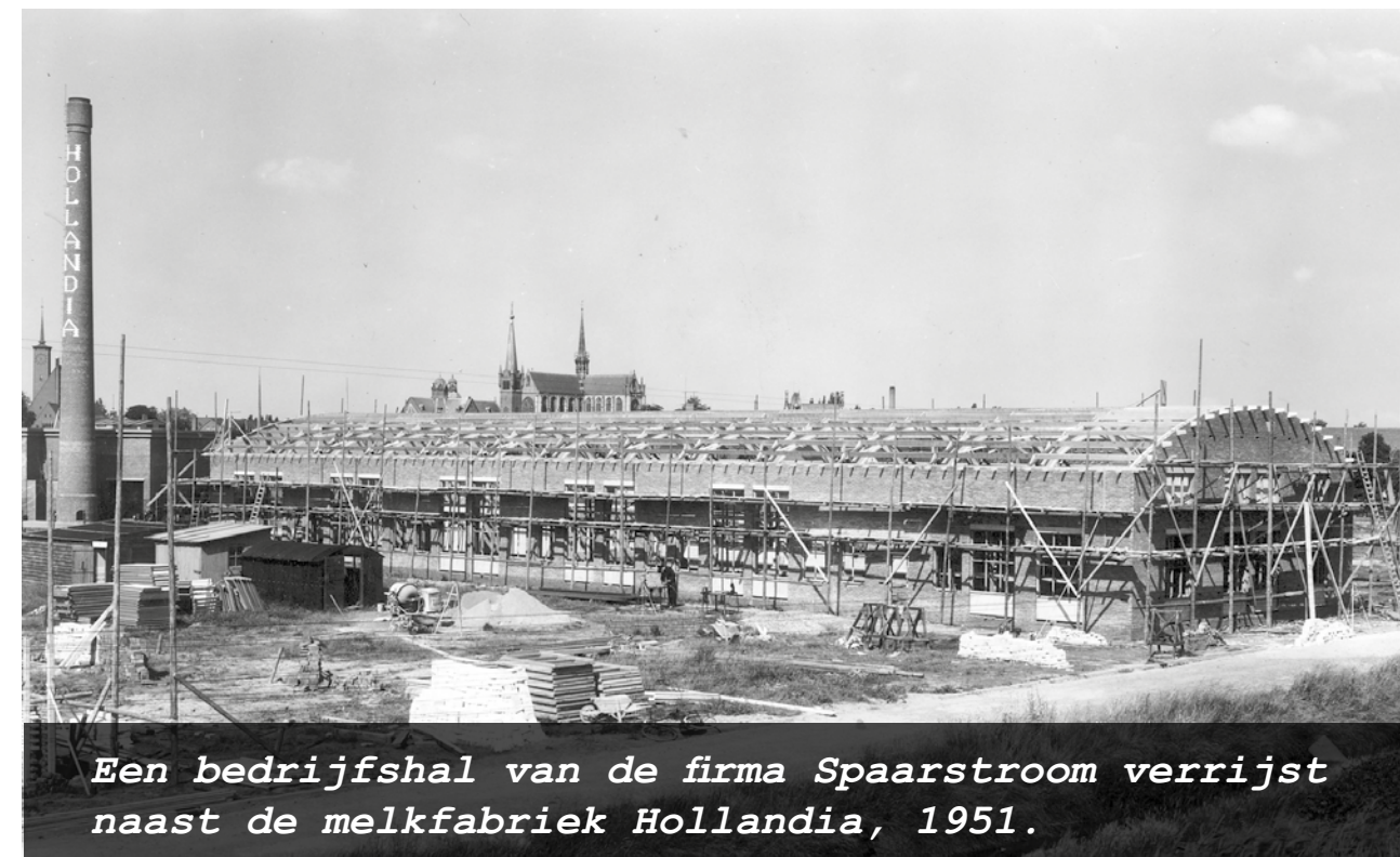
Een bedrijfshal van de firma Spaarstroom verrijst naast de melkfabriek Hollandia, 1951.

Allereerst vestigt zich hier melkontvangststation Hollandia in 1950, onderdeel van een Vlaardings