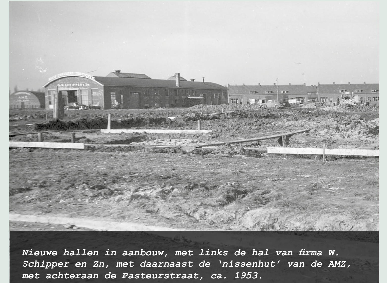
Nieuwe hallen in aanbouw, met links de hal van firma W. Schipper en Zn, met daarnaast de 'nissenhut' van de AMZ, met achteraan de Pasteurstraat, ca. 1953.

>> De Vlaardingse melkfabrikant Hollandia heeft diverse fabrieken in het land, folder Hollandia, ca. 1955.