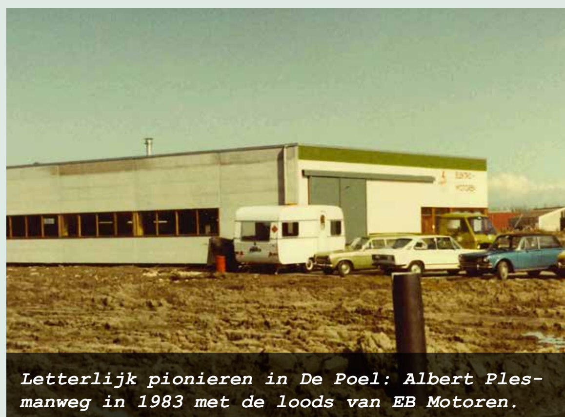
Letterlijk pionieren in De Poel: Albert Plesmanweg in 1983 met de loods van EB Motoren.