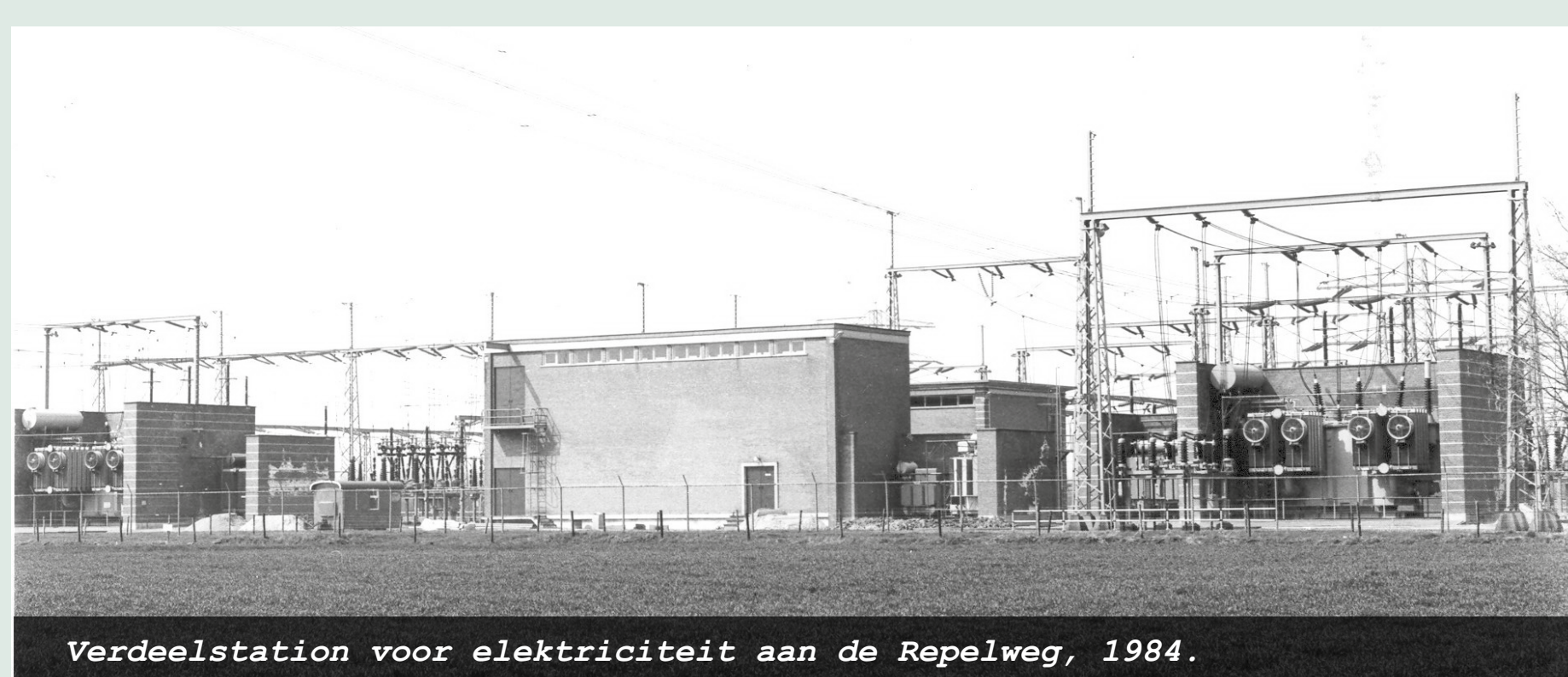
Verdeelstation voor elektriciteit aan de Repelweg, 1984.