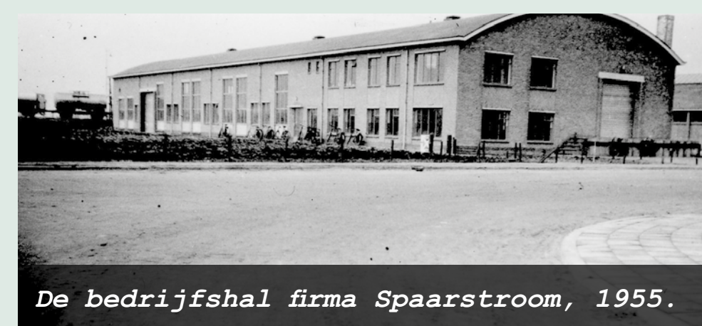
De bedrijfshal firma Spaarstroom, 1955.