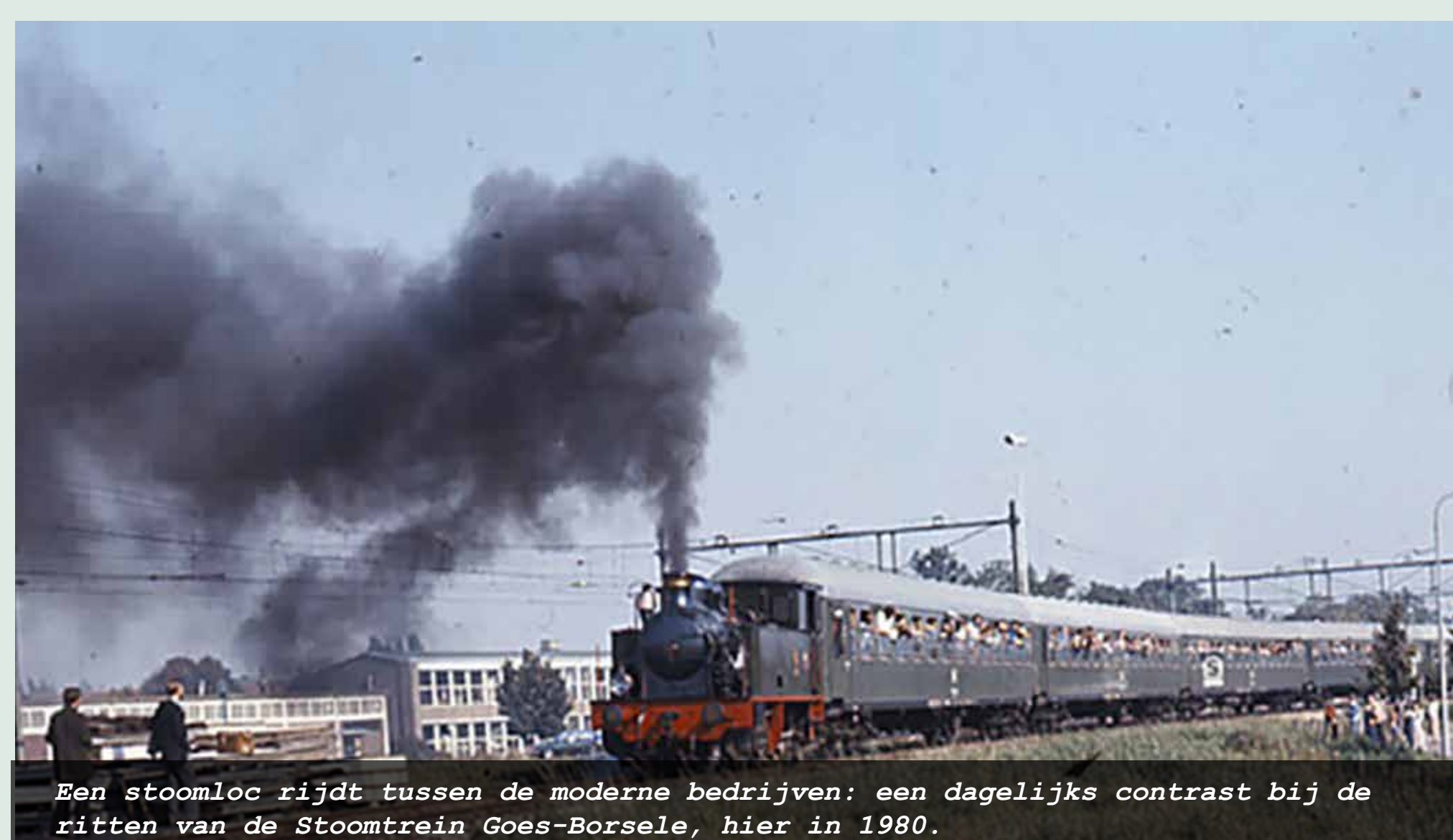
Een stoomloc rijdt tussen de moderne bedrijven: een dagelijks contrast bij de ritten van de Stoomtrein Goes-Borsele, hier in 1980.