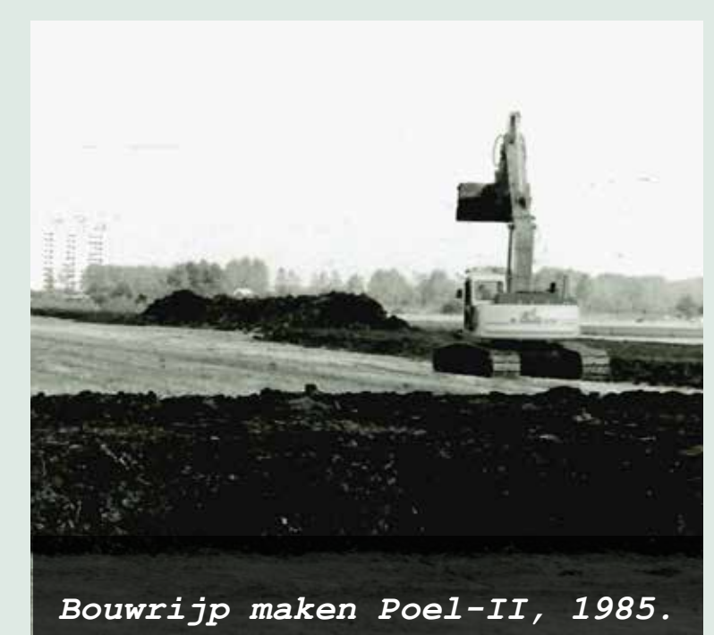
Bouwrijp maken Poel-II, 1985.