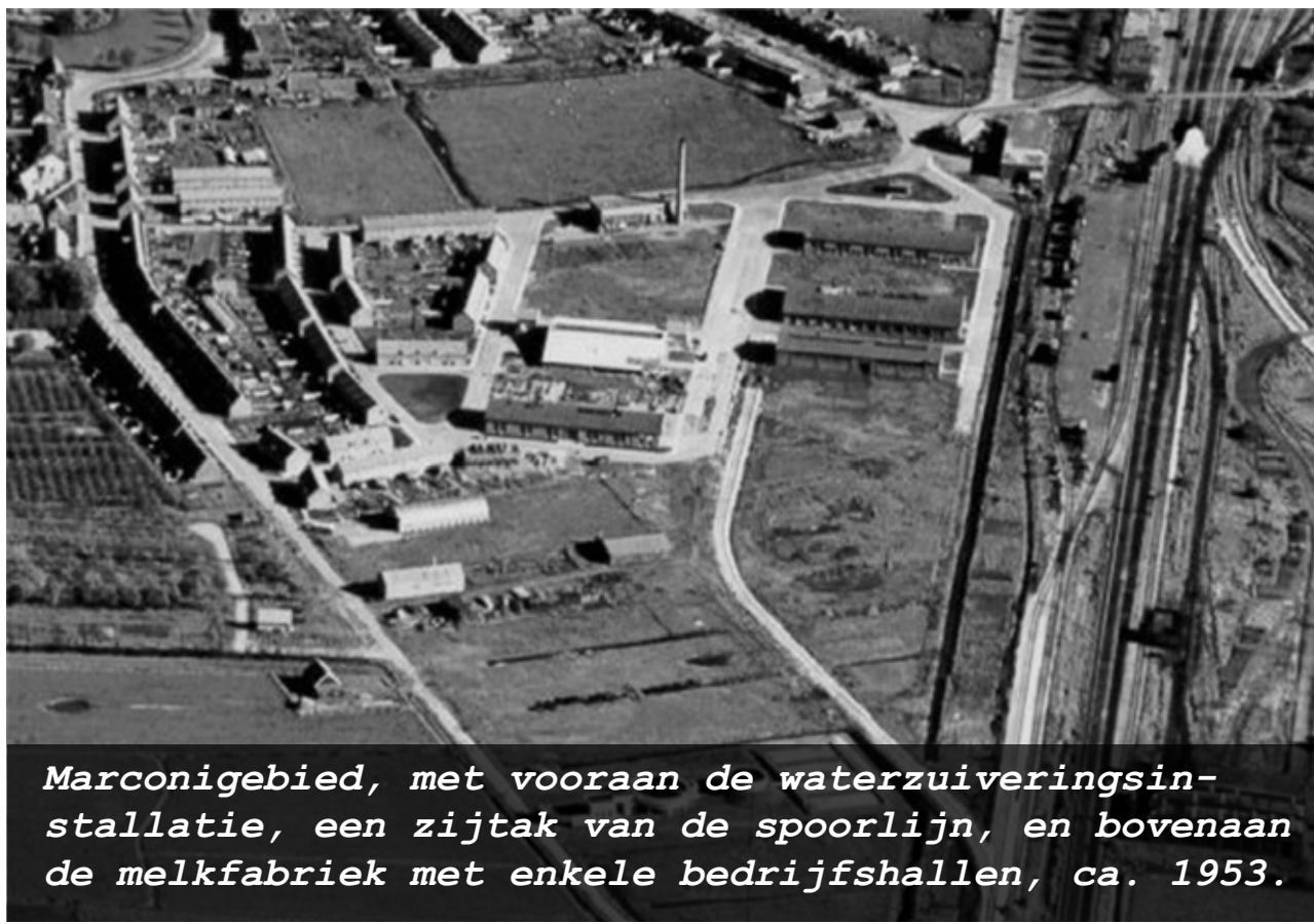
Marconigebied, met vooraan de waterzuiveringsinstallatie, een zijtak van de spoorlijn, en bovenaan de melkfabriek met enkele bedrijfshallen, ca. 1953.

Ook nieuwe ondernemingen melden zich. Het Uitbreidingsplan 1947 biedt uitkomst, omdat het Poelgebied ten zuiden van de Zuidvlietstraat (eerst: Poelweg) tot bedrijventerrein wordt bestemd.