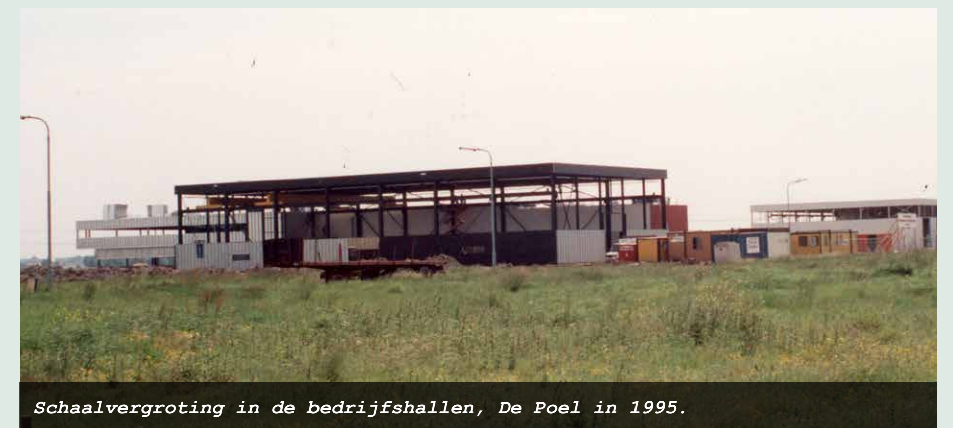
Schaalvergroting in de bedrijfshallen, De Poel in 1995.