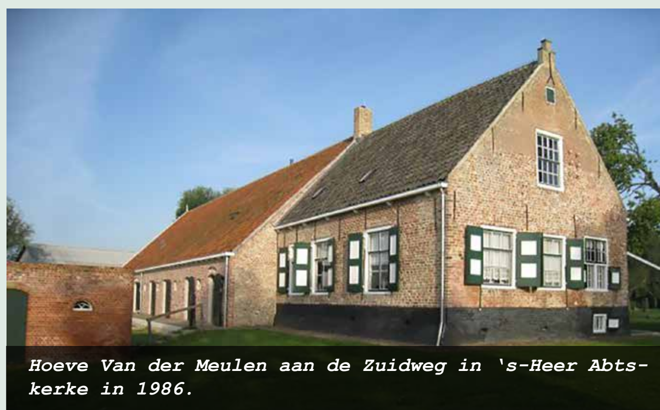
Hoeve Van der Meulen aan de Zuidweg in s-Heer Abtskerke in 1986.