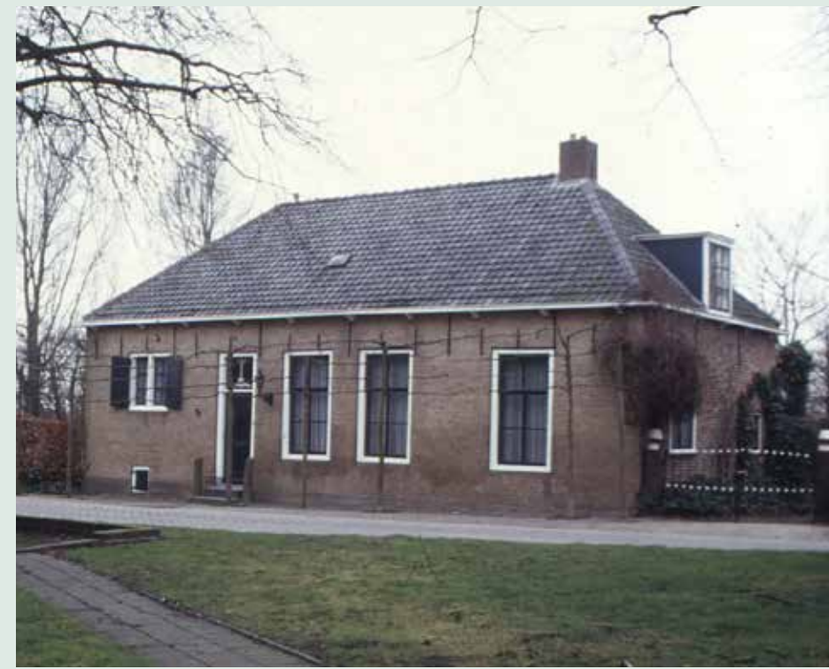
Boerderij Plantlust aan Kerkring s-Heer Abtskerke. Foto 1990.