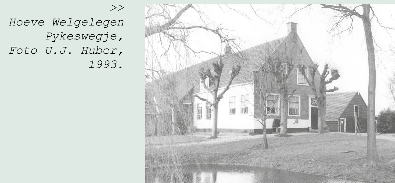
Hoeve Welgelegen Fykeswegje, Foto U.J. Huber, 1993.