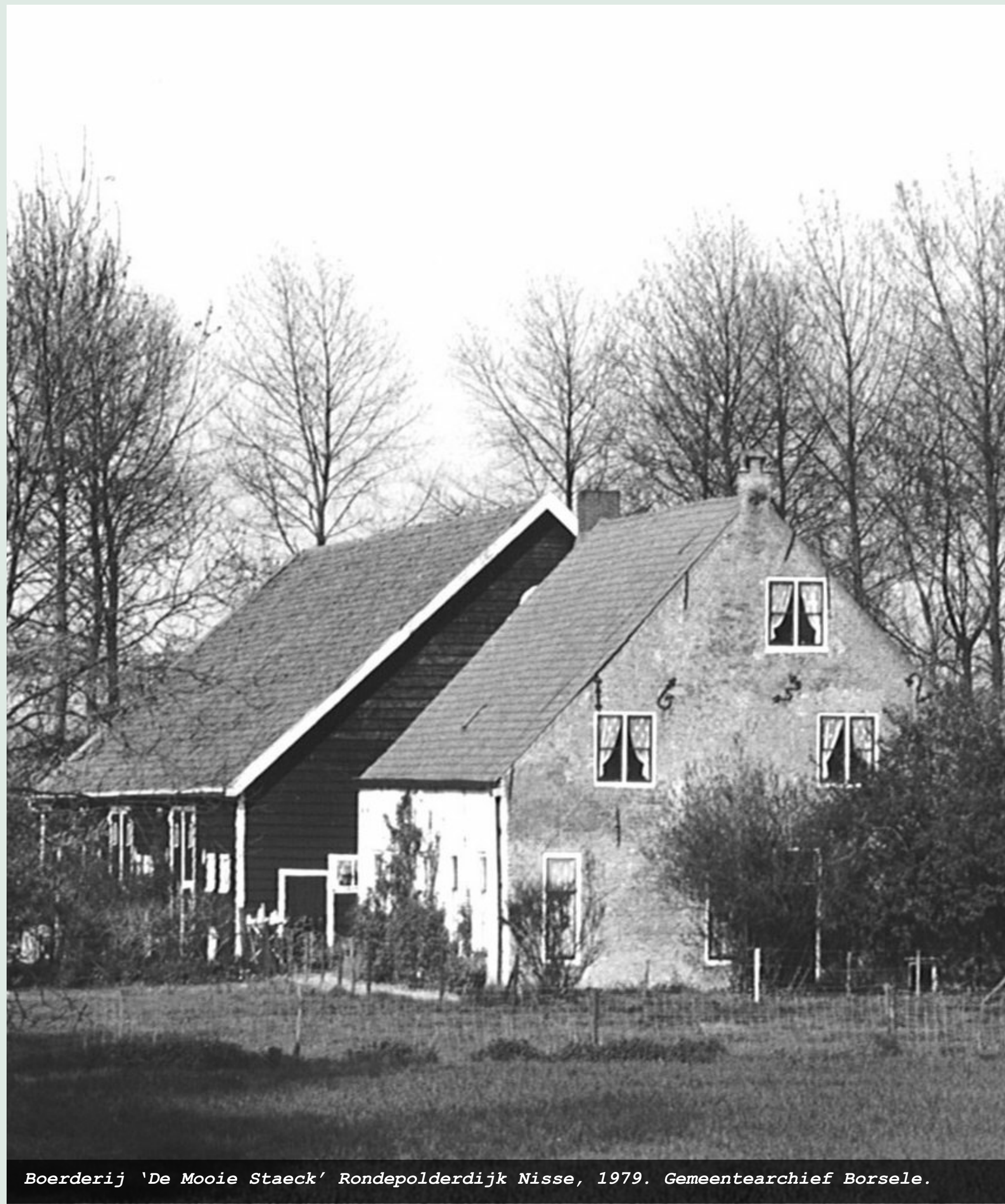
Boerderij 'De Mooie Staeck' Rondepolderdijk Nisse, 1979.