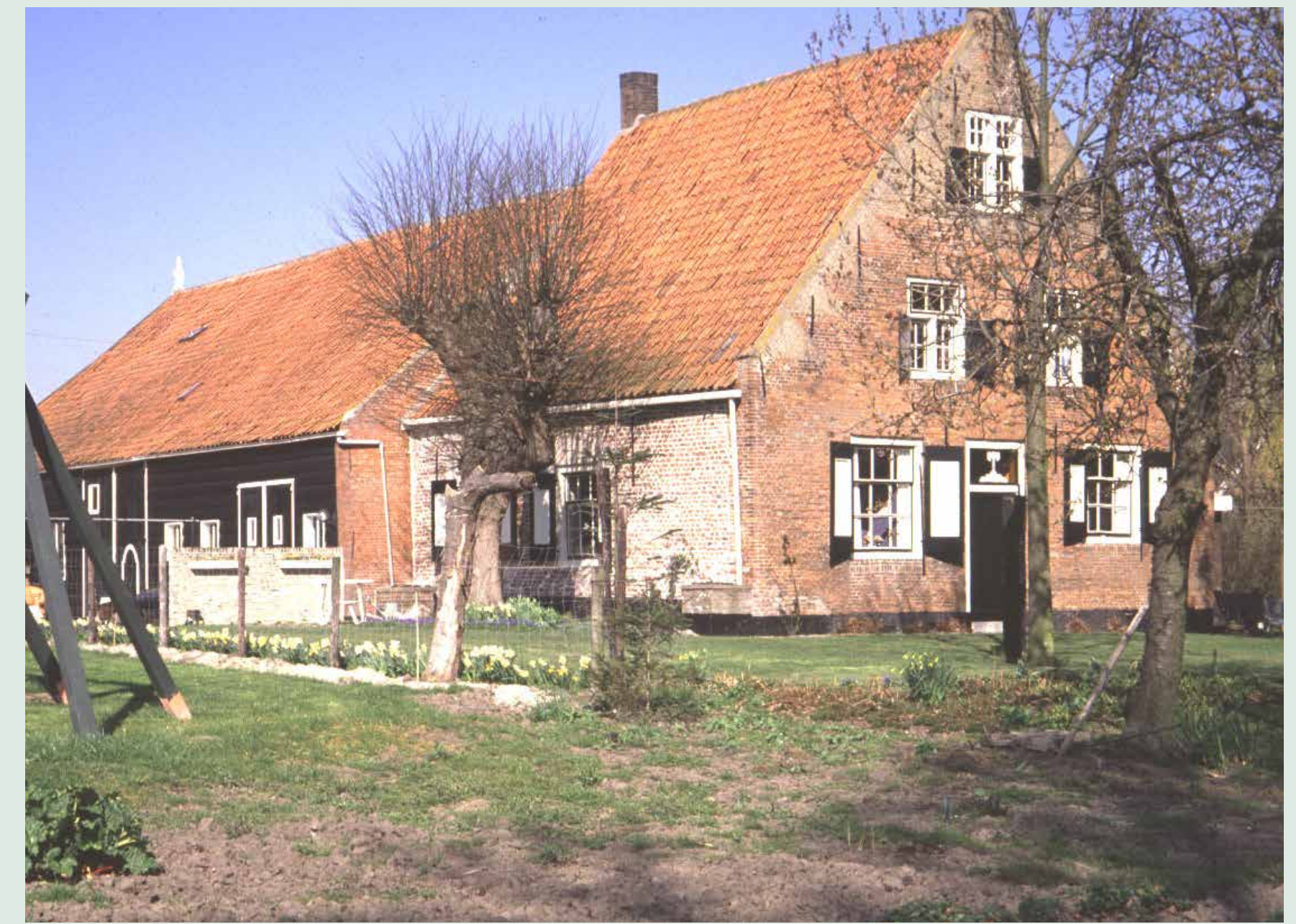
Boerderij familie Korstange Oude Rijksweg s-Heer Hendrikskinderen, 1991.