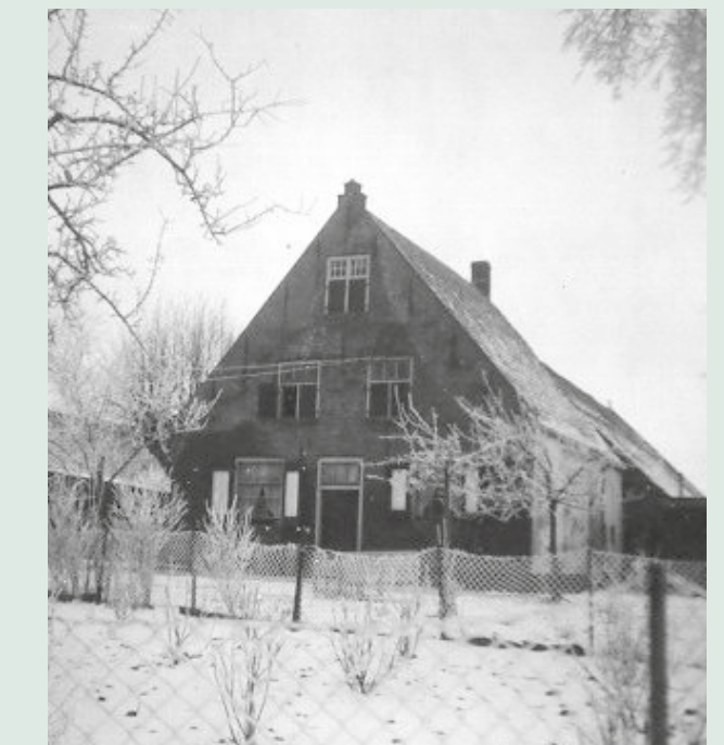
Boerderij familie Korstange Oude Rijksweg s-Heer Hendrikskinderen, 1991.