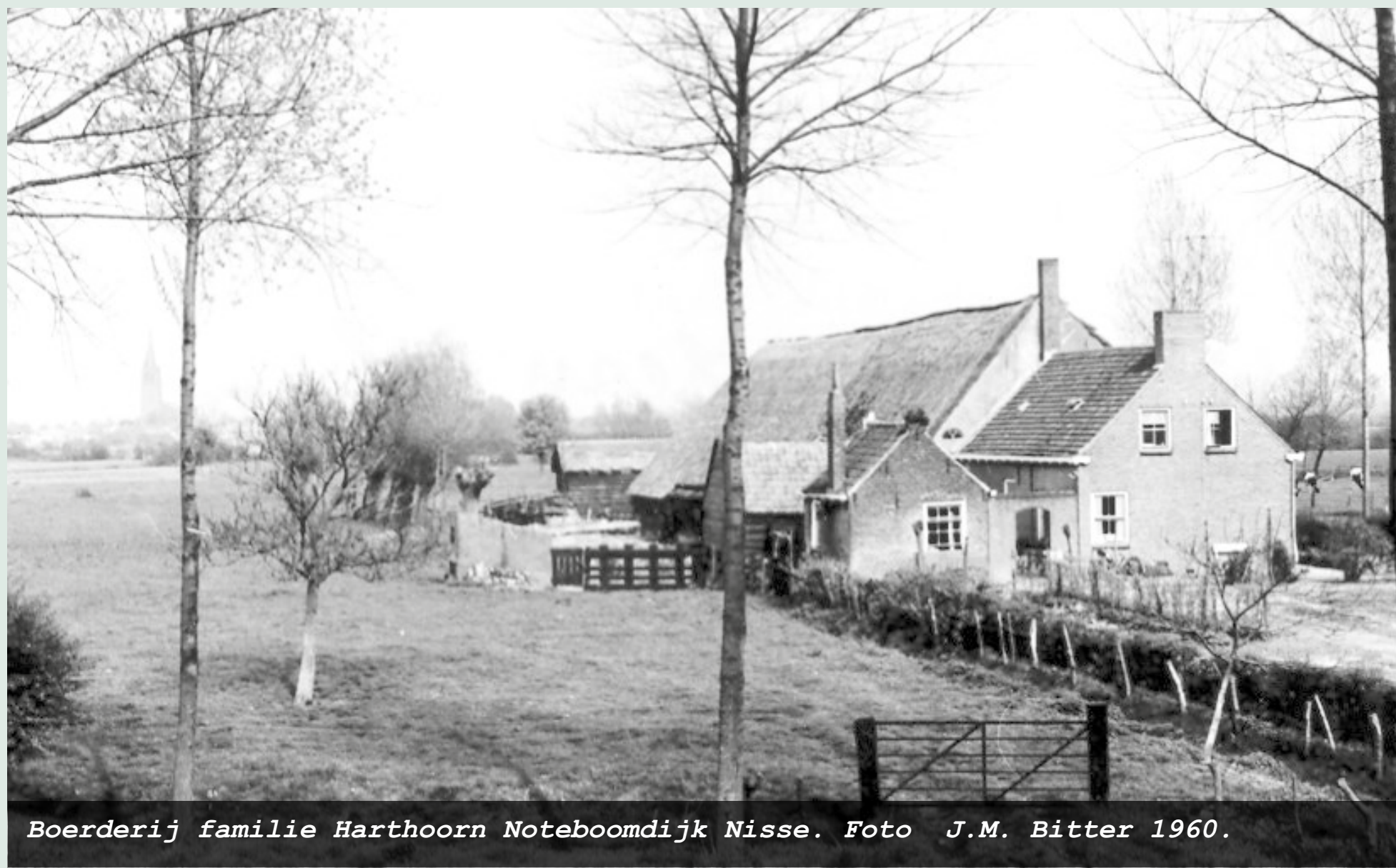
Boerderij familie Harthoorn Noteboomdijk Nisse. Foto J.M. Bitter 1960.