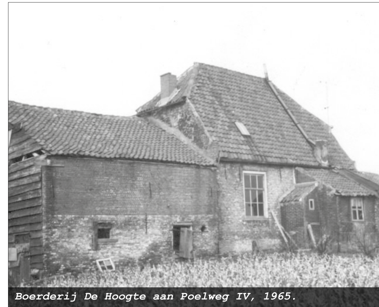
Boerderij De Hoogte aan Poelweg IV, 1965.

Slechts hier en daar zijn monumentale woonhuizen, sommige nog daterend uit de zeventiende eeuw, bewaard gebleven. Met de ruilverkaveling zijn er moderne boerenbedrijven bijgekomen in De Poel.