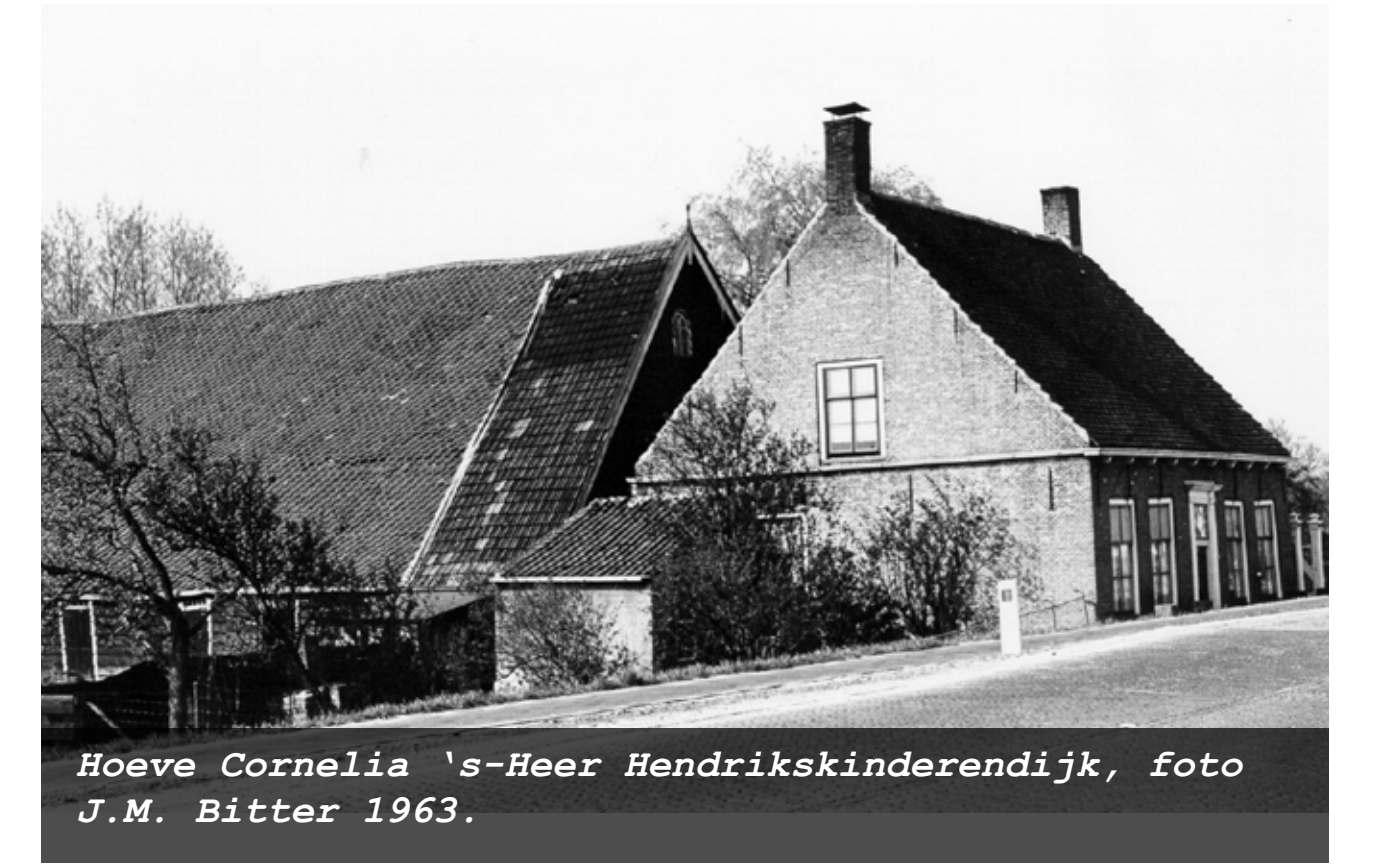
Hoeve Cornelia s-Heer Hendrikskinderdijk, foto J.M. Bitter 1963.

In de grotere Poeldorpen zijn de boerderijen geleidelijk aan uit de dorpskern verdwenen. Aan de dorpsranden of nog verder buiten de bebouwde kom zijn in de negentiende/twintigste eeuw nieuwe hoeven gebouwd. Opvallend is dat ze in Baarsdorp, Sinoutskerke en 's-Heer