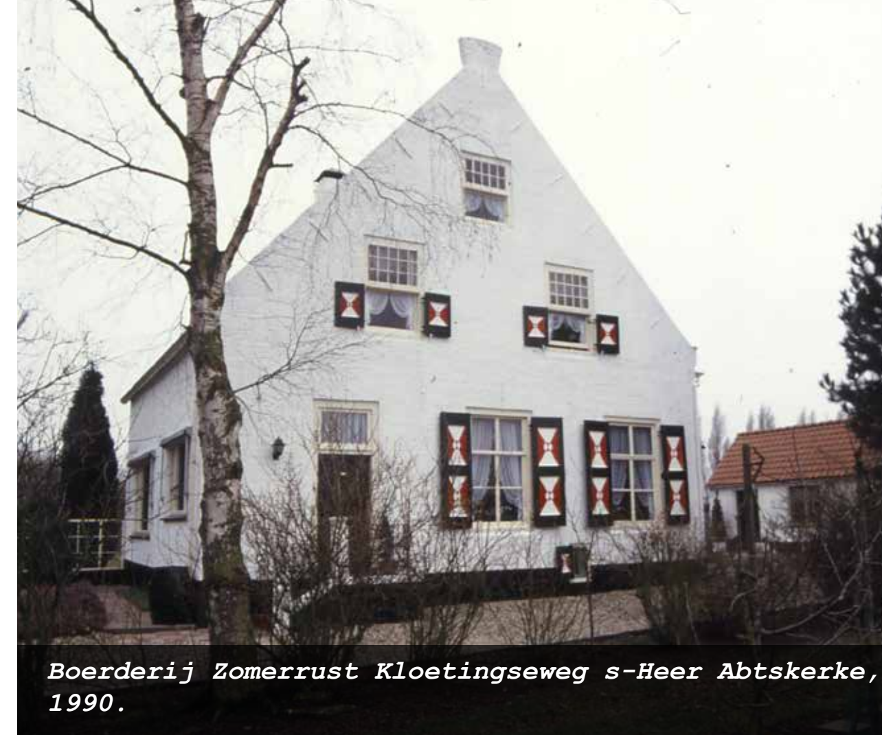
Boerderij Zomerrust Kloetingseweg s-Heer Abtskerke, 1990.

Abtskerke nog ruim aanwezig zijn midden in de kern. Omdat boerderijen ook vooral werkruimten zijn, hebben de eigenaren ze herhaaldelijk aan de eisen van de tijd aangepast.