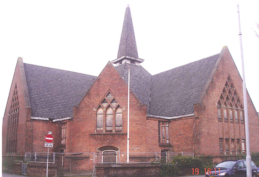
Foto 2. De Petruskerk in Vlissingen.

van de Westwal werd verbreed ten behoeve van het doorgaand verkeer. Voordat de aankoop van de grond definitief was moest nog een onderzoek plaats vinden naar de draagkracht van de ondergrond. Men was voorzichtig vanwege het plan om te gaan bouwen op geroerde grond (van oude vestingwerken) en daar moet je berekenend mee omgaan. De uitkomst van het onderzoek was dat de kerkzaal en de bijgebouwen op een traditionele fundering konden worden gebouwd maar dat de toren een houten paalfundering moest krijgen. Met deze kennis werd verder gewerkt en werd het terrein op 13 mei 1929 aangekocht. In 1930 werden nog eigendomsgrenzen aan de kant van de Westwal gecorrigeerd door middel van ruiling en grondaankoop en werden enkele waterpartijen gedempt.