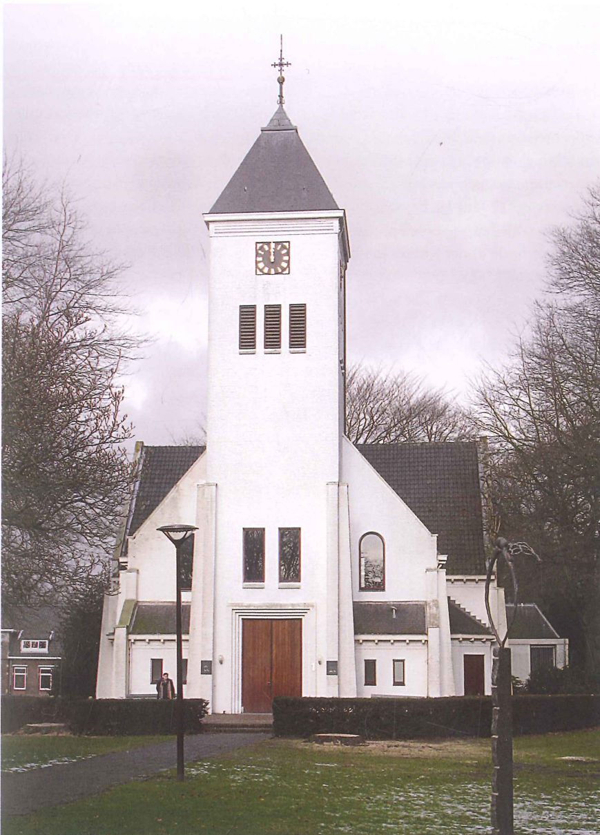
Foto 1. De Ark, kerk op het terrein van Vrederust bij Halsteren.