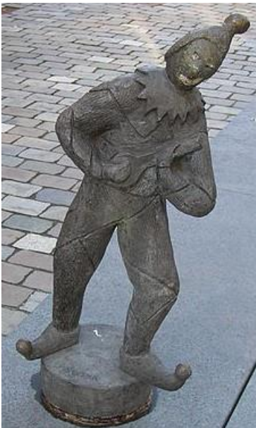
'De Harlekijn' bij het Schuttershof te Goes van kunstenaar Jan Buzink uit 1987.

Op 31 december 1711 is er een verbod op Rethorijkspelen namen de Staten van Zeeland door middel van een nieuw plakkaat. De aanleiding is dat men op het platteland in 'Zuijt-Bevelandt' op tweede pinksterdag een beeld van de heilige St. Barbara (de patrones van 's-Gravenpolder) droeg en dat men was bezig een toneelopvoering voor te bereiden voor de 6 e januari (Driekoningen).