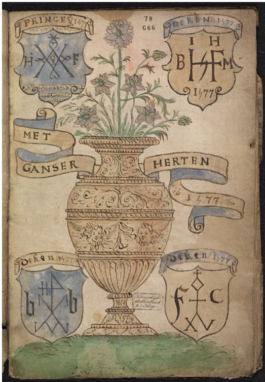
Titelblad van handschrift 78 C 66 uit de Koninklijke Bibliotheek met nardusbloemen, de zinspreuk 'Met ganser herten' en de merktekens van de prins en de dekens.

gang van zaken in de kamer in goede banen moesten leiden. Bijvoorbeeld hoe de kamerleden gekleed dienden te gaan en gehoorzaamheid waren verschuldigd aan de prins en de dekens. Elk gildelid moest de eed zweren dat hij zich, op straffe van een boete, zou houden aan de regels uit het statuut. 6