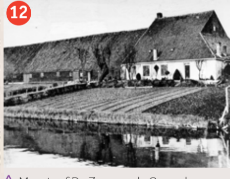
12 Meestof De Zon aan de Goese haven, ca. 1930.