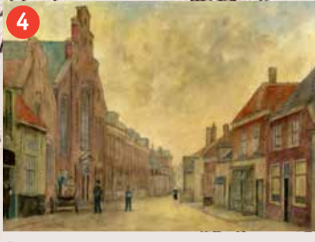
4 De Wijngaardstraat, waar de familie Blaubeen woont.