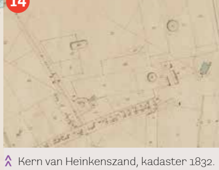
14 Kern van Heinkenszand, kadaster 1832.