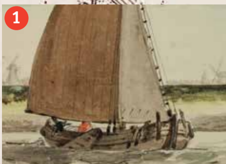
1 Zeilschip bij Goes, A. Schouman, 18de eeuw. RCE.