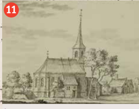
11 Eversdijk in 1632, J. Stellingwerf RCE.