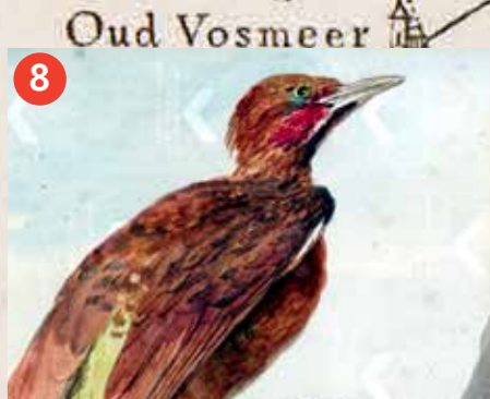
8 Vaalkuifspecht van Slabber, A. Schouman, 1768. RKD.