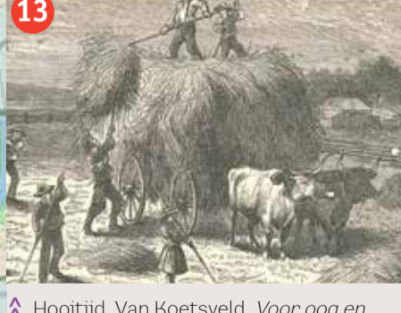
13 Hooitijd, Van Koetsveld, Voor oog en hart.