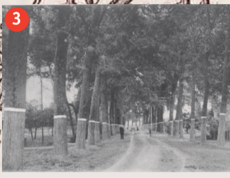
3 De 'nieuwe' Postweg tussen Verseke en Kapelle, foto ca. 1900.