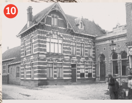
10 Het Schuttershof aan de Kreukelmarkt, ca. 1920.