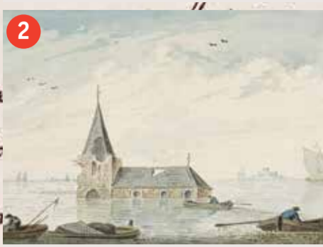
2 Het verdronken dorp Tolseinde, 18de eeuw. ZA.