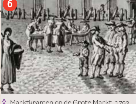
6 Marktkramen op de Grote Markt, 1793.