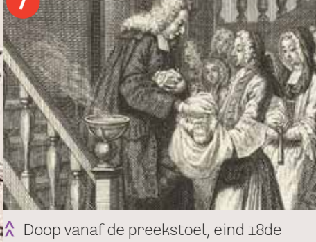
7 Doop vanaf de preekstoel, eind 18de eeuw.